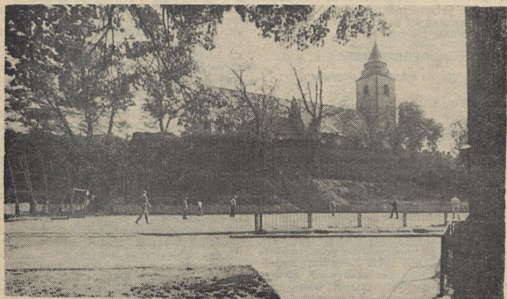
Co przedstawia to zdjęcie? Oto nasza wakacyjna zagadka. Wśród autorów poprawnych odpowiedzi rozlosujemy trzy

O dalszych poczynaniach zainteresowanych stron Zarząd będzie sukcesywnie informował.