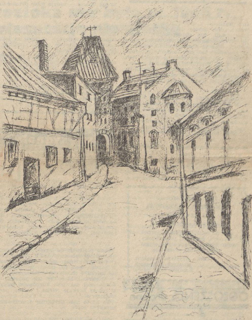
ZAULEK — Rys. M.C.

Również uwadze pana wójta z Wądroża Wielkiego polecamy (kolejny już raz) domek w Bielanych, należący do miejscowej RSP. W przypadku dalszego milczenia sprawą zainteresujemy zgodnie z prawem prasowym, pana prokuratora.