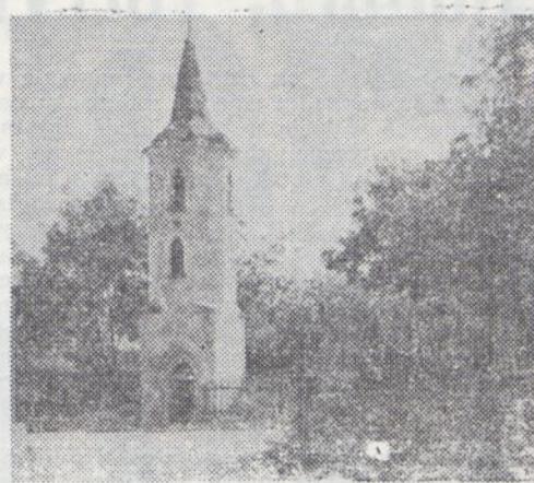
Przedstawiona na zdjęciu dzwonnica z 1869 r. stoi w środku Zimnika. Niegdyś służyła do zwolniania do pracy robotników kamieniołomów. Wymaga remontu. Skradziony z niej dzwon już się odnalazł i jest przechowywany u sołtysa.

Poskutkowałam naszą krytyką zaniedbań w Zimniku. Widać, że wzięto się tam do roboty. Zniknęła wałająca się ruina, studzienki zabezpieczono pokrywkami, mówi się o rozwiązaniu problemów z dostawą wody. Cieszy nas to bardzo, bowiem z miejscowości tą wiążemy pewne nadzieje. Wieś położona u stóp Wzgórz Strzegomskich, znana była już w XV w. Przez dłuższy czas była folwarkiem pobliskiego Niedaszowa. W bezpośrednim jej sąsiedztwie znajdują się nieczynne już wyrobiska granitu zalane wodą, z których korzysta wielu jaworzan ze względu na bardzo czystą wodę. Przy okazji przestrzegamy tych, którzy jeszcze słabo pływają, bowiem kąpielisko to nie jest strzeżone! Być może znajdzie się ktoś, kto tu zainwestuje? Pragniemy również zainteresować kogoś budynkiem, w którym znajdowała się kiedyś świetlica wiejska, a który obecnie stoi pusty i niszczeje. Budynek, jak widać na tabliczce, jest własnością Gminy, która — naszym zdaniem — chętnie wystawi go na sprzedaż.