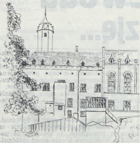
Rys. Sł. Kozłowski