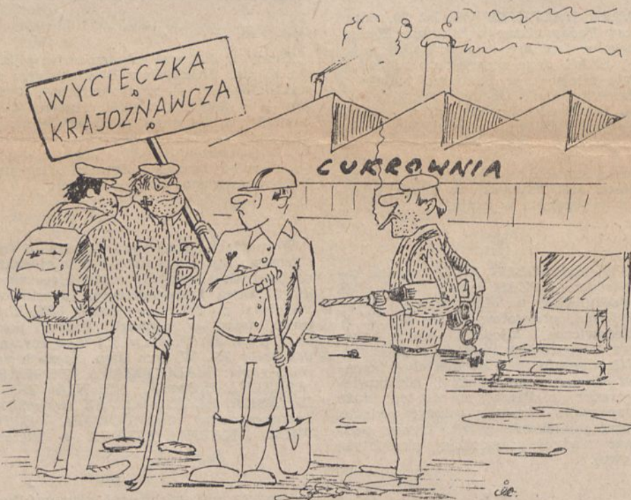
Rys. T. Idzik

9 marca w Legnicy odbył się międzyzakładowy turniej piłki siatkowej mężczyzn organizowany przez OSiR i NSZZ „Solidarność” w Legnicy. W turnieju wzięła udział drużyna SI „Inprodus”, reprezentowana przez zawodników głuchoniemych, zajmując 3 miejsce. Zwyciężyła drużyna z Legnickiej Fabryki Fortepianów.