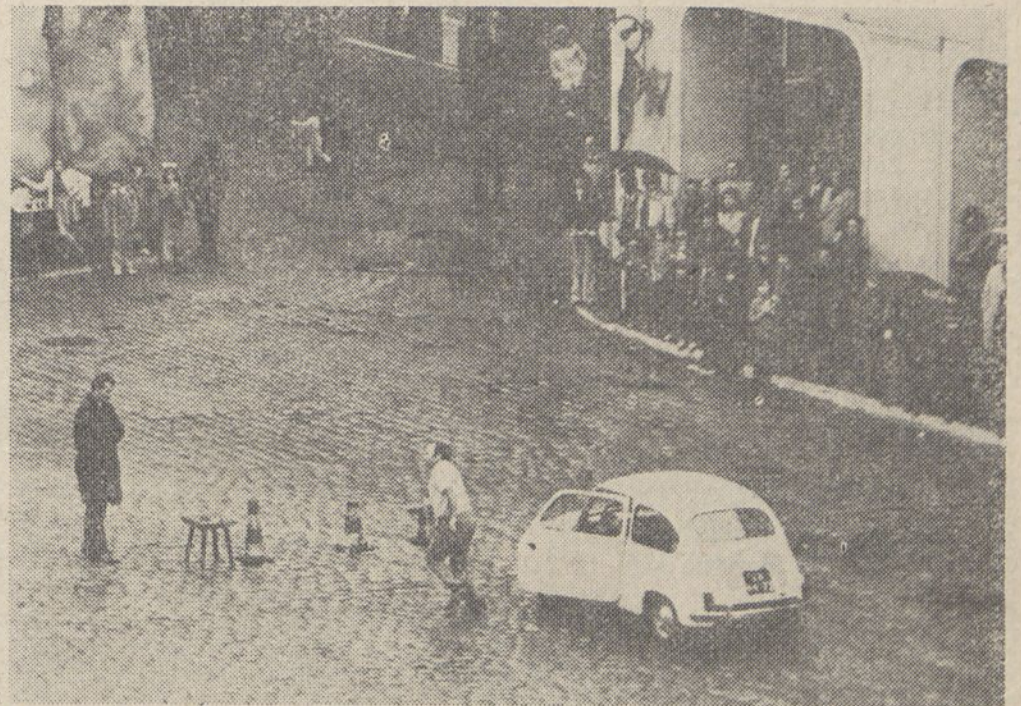
Zorganizowano w tym czasie szereg zawodów, tzw. gymkhamy, rajdy patrolowe oraz wyścigi na czas...