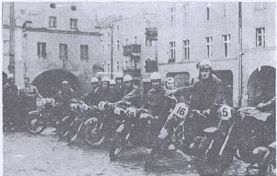
W tamtych latach odbywały się też często imprezy motorowe. O nich w następnym odcinku wspomnieliśmy