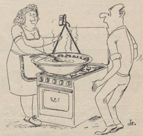
— Wspaniały garnek kupiłeś mężu, tylko trochę za duży. Rys. T. Idzik

Zamiar dokonania zwolnień grupowych zgłosił Rejonowy Związek Spółek Wodnych w Jaworze, który zostanie postawiony w stan likwidacji. W związku z tym pracę utraci 14 osób. PTHW w Legnicy natomiast ma zamiar rozwiązać umowę o pracę z 8 osobami.