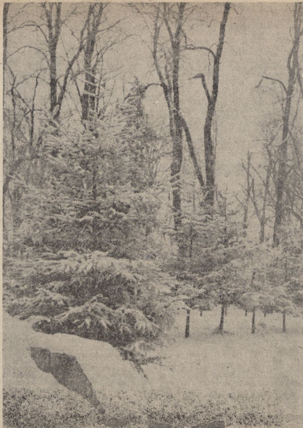
A w górach już zima...

24 bm. z parkingu na ul. Szpitalnej nieznanymi sprawcami ukradli z karetki pogotowia dwie błyskowe lampy sygnalizacyjne na szkodę Rejonowej Kolumny Transportu Sanitarnego w Jaworze. Postępowanie prowadzi KRP w Jaworze.