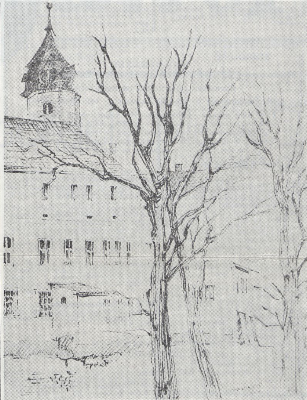
Rys. B. Stępień