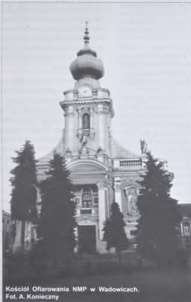
Kościół Ofiarowania NMP w Wadowicach.

Ks. Henryk Kardynał Gulbinowicz Arcybiskup Metropolita Wrocławski