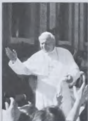
Okladka str. I: papież Jan Paweł II.