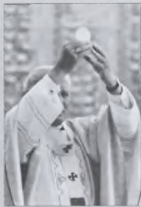
Okladka str. 1