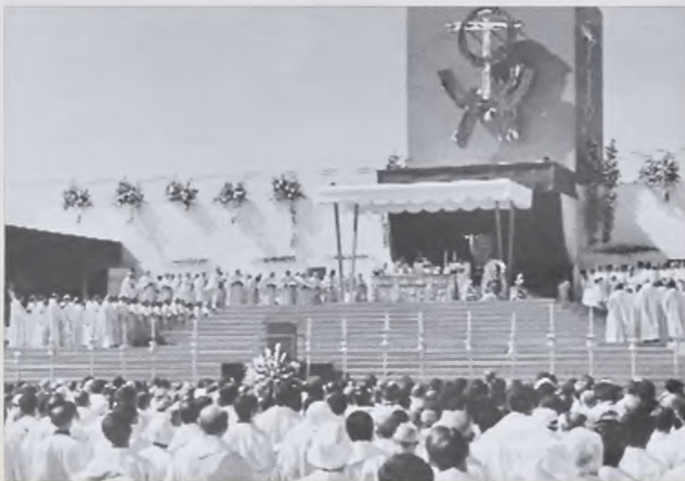
Msza św. na zakończenie 45. Międzynarodowego Kongresu Eucharystycznego w Sewilli.

Myśli swe przedstawiła najpierw gorącemu entuzjastcie nabożeństw eucharystycznych – św. Piotrowi Eymardowi, który jeszcze w 1856 r. założył w Paryżu Zgromadzenie Kapłanów od Najświętszego Sakramentu