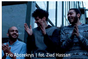
Trio Abozekrys