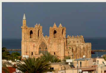
Opis: Fotomontaż.