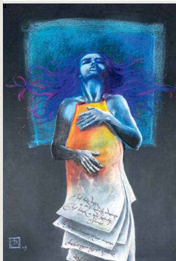
R. Syta, „Upojenie”