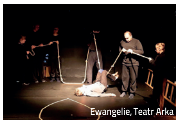
Ewangelie, Teatr Arka