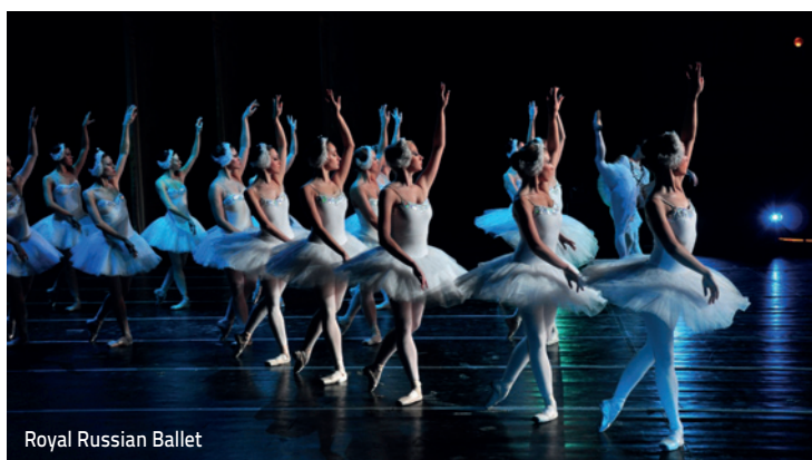
Royal Russian Ballet