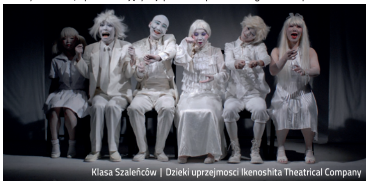
Klasa Szaleńców | Dzieki uprzejmoci Ikenoshita Theatrical Company

12 października po spektaklu (dla widzów od lat 18) odbędzie się spotkanie z twórcami | Bilety: 40/50 zł | Spektakle w języku japońskim z polskimi i angielskimi napisami