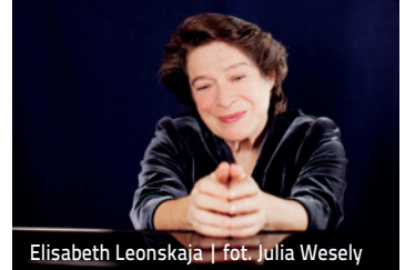
Elisabeth Leonskaja

Tematem przewodnim tego koncertu jest wielopłaszczyznowy dialog tradycji i awangardy. Publiczność usłyszy kompozycję współczesnego twórcy, chętnie sięgającego do dziedzictwa przeszłości, następnie dzieło niegdyś nowatorskie, a należące obecnie do kanonu, a także przystępny utwór napisany przez jednego z kompozytorów pozostających niegdyś w czołówce awangardy.