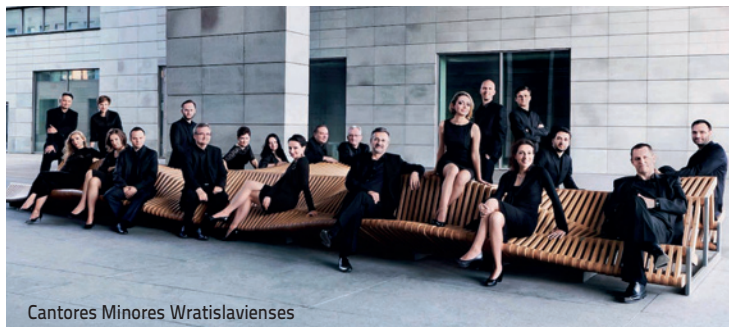
Cantores Minores Wratislavienses