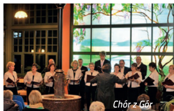
Chór z Gór