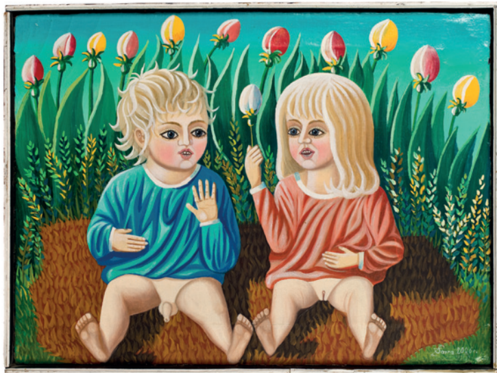
Otwarty teren