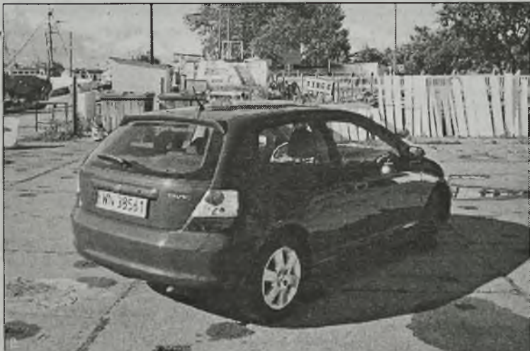
Auto byłoby rewelacyjne, gdyby nie mało dynamiczny silnik 1.4