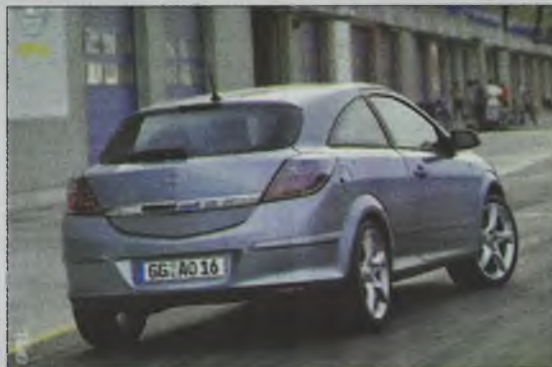
Mało który Opel wyglądał tak, jak Astra GTC

Powtórzę to raz jeszcze: dobrze być rolnikiem! Ale w Niemczech.