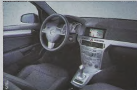
Wnętrze niby surowe, jednak dopracowane w szczegółach