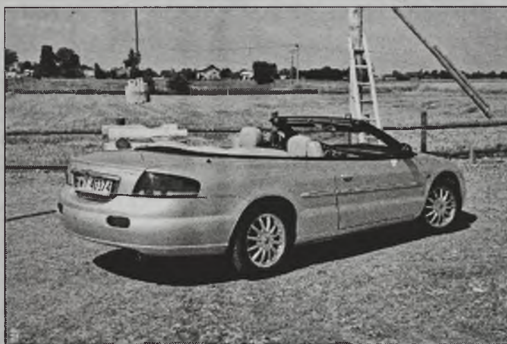
Nadwozie może się podobać, ale tylko w ciepłych krajach

Reszta auta jest już do przyjęcia. Sebring w nowej szacie otrzymał nad wy-