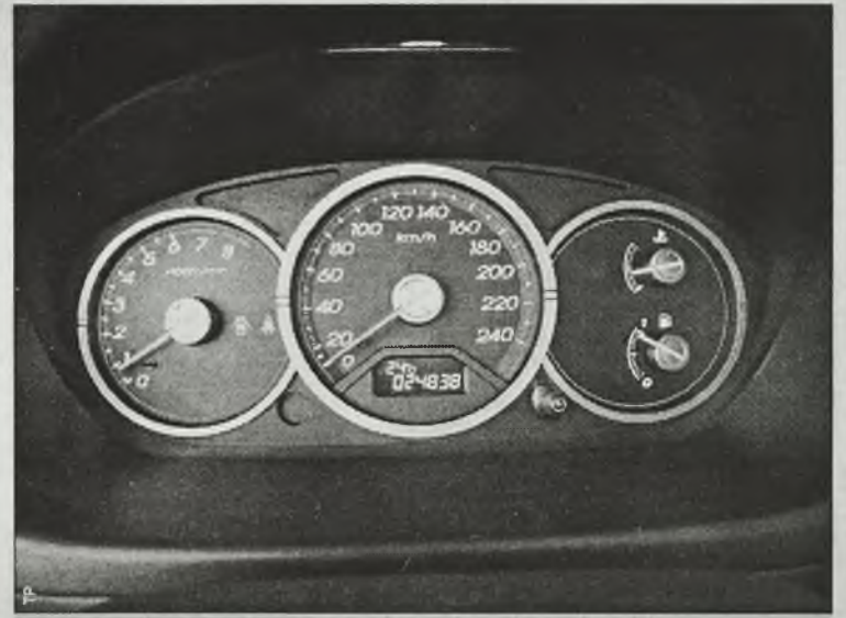
Zegary wykonane są z dużym wyczuciem i dbałością o szczegóły

był manekin „potrącony” przez kompaktową Hondę, otrzymała ona trzy gwiazdki i był to jeden z najlepszych wyników. Nie należy się więc spodziewać większych zmian w stylistyce tej części nadwozia. Niestety długie maski poprzedników odeszły w przeszłość.