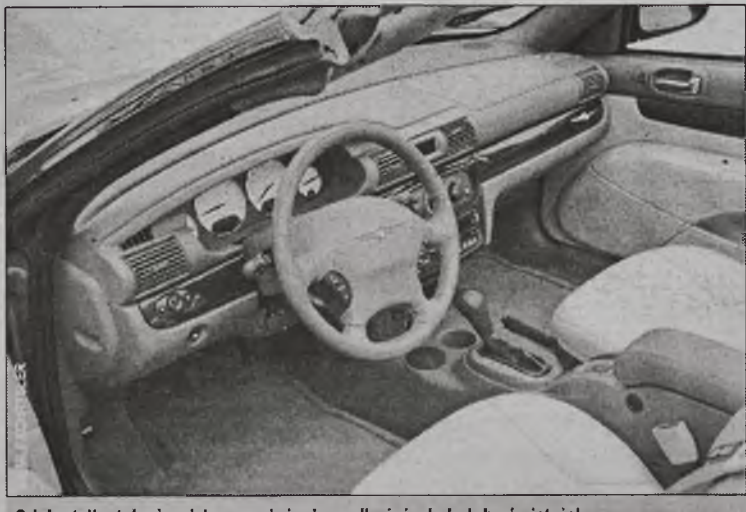
Gdyby tylko tak nie wiało przy dużych prędkościach, byłoby świetnie!