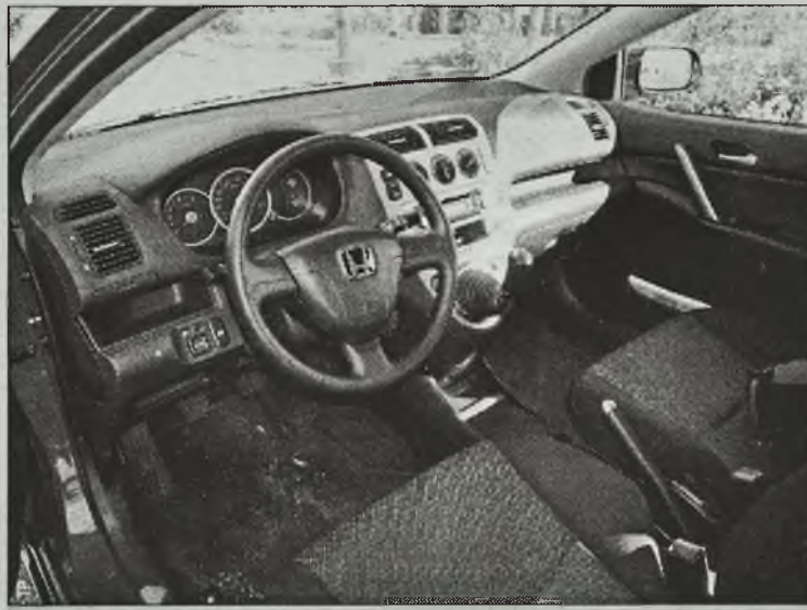
Dźwignia skrzyni biegów w tym miejscu to bardzo dobre rozwiązanie

je się tylko góra-dół. Wysoki kierowca ma więc tradycyjny dylemat: albo podkurczone nogi, albo zbyt wyciągnięte ręce. Tak źle, a tak niedobrze. Na domiar złego, jeśli opuścimy kierownicę mocno w dół, to z oczu stracimy część kontrolki. Zawsze natomiast pozostanie zasłonięta dioda sygnalizująca włączone