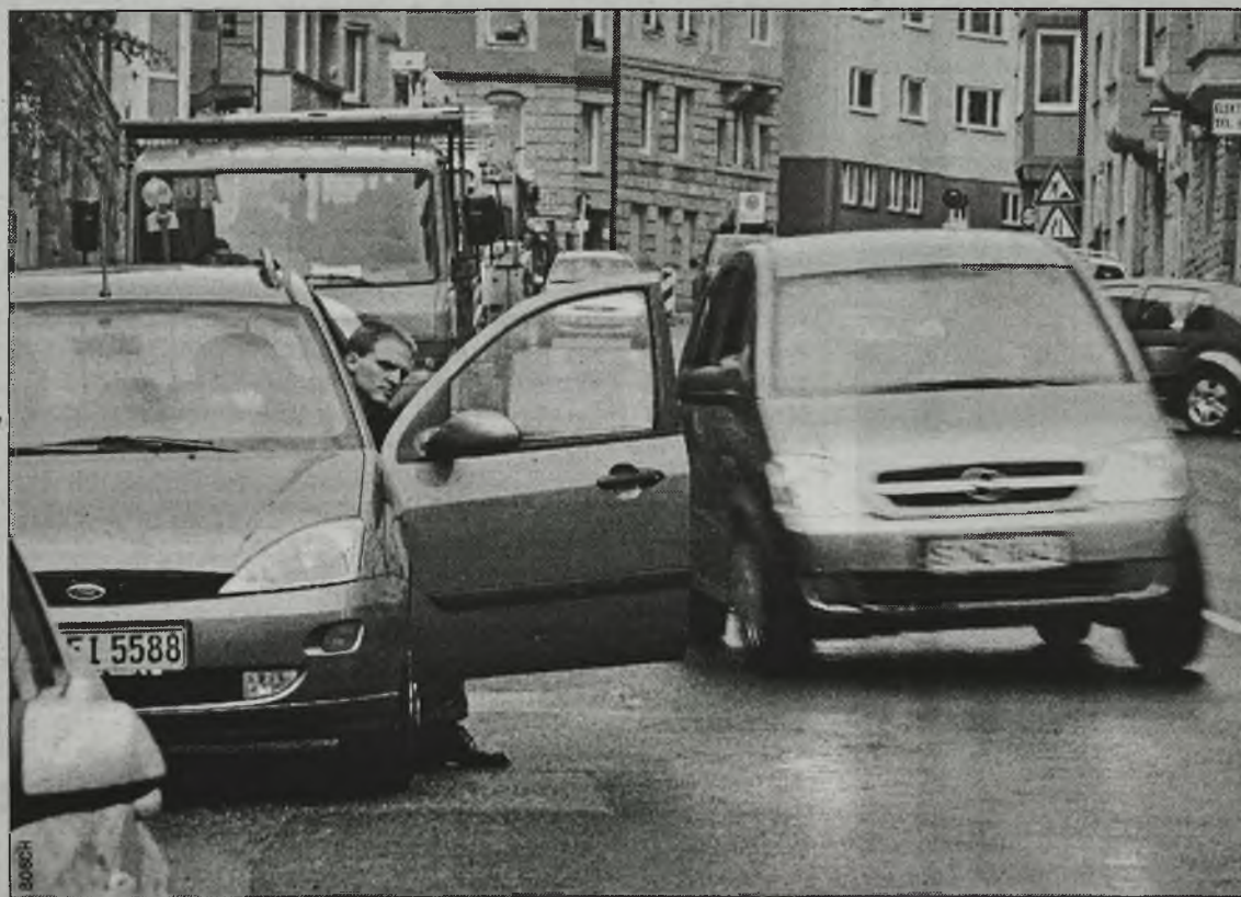
Takie nieprzewidywalne sytuacje mogą zakończyć się kolizją. Jednak ESP zawsze jest w pogotowiu