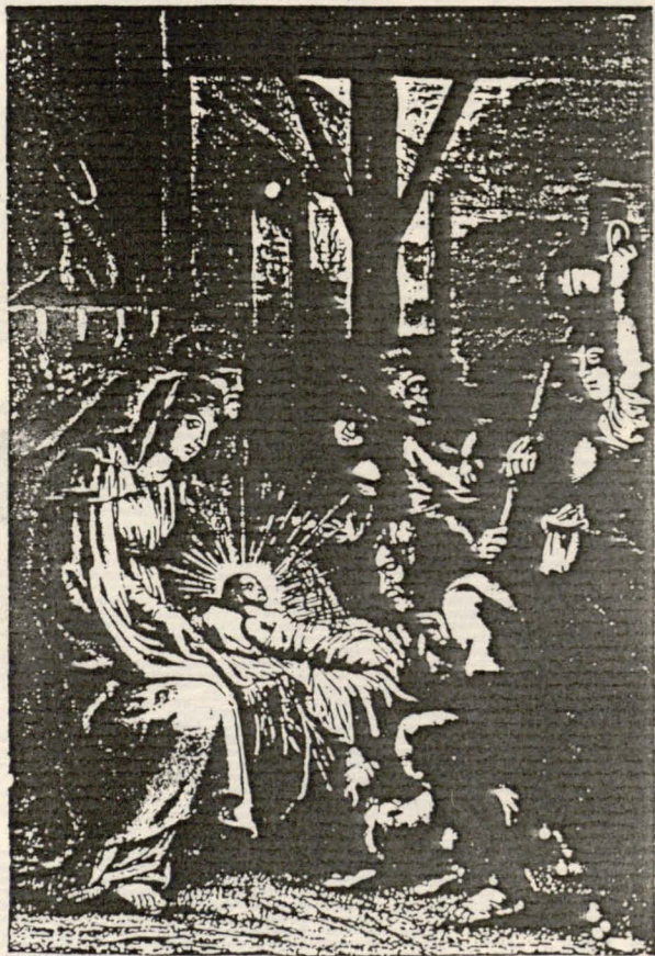
Narodziny Chrystusa, autor nieznany, miedzioryt