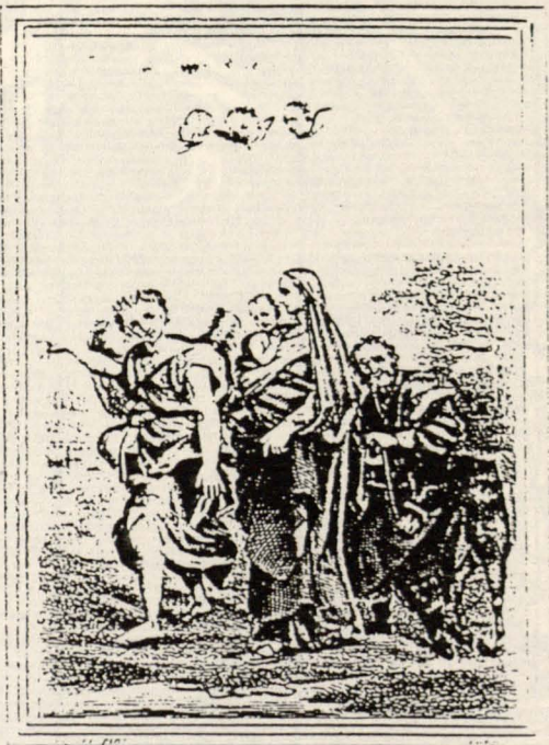
LA FUIITE EN ÉGYPTE