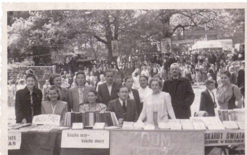
Pierwszy kiermasz D.K. w Stanisławowie "Festyn."

Od 1949 roku pracował już w księgarni Spółdzielczej „Książka i Wiedza” przy ulicy 1-go Maja 10 w Jeleniej Górze. Ciągłe się doksztalał i jako jeden z pierwszych w Polsce ukończył w 1957 roku Technikum Księgarskie w Poznaniu i na resztę swojego zawodowego życia związał się z Jelenią Górą. To właśnie w tym miejscu, narodził się jeleniogórski „Dom Książki” (1950) oraz Klub Księgarza (1959).