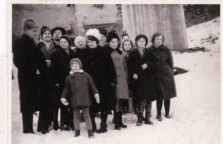
Księgarza na Snieżce