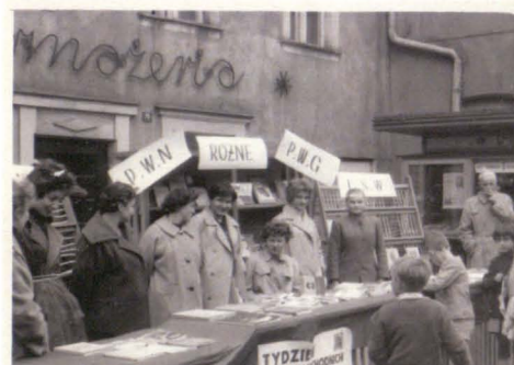
Otwarcie księg. 1 Maja w 1952r.

Chęć pracy i zdobywania wiedzy przyciągnęły go do Jeleniej Góry. Od 1947 roku przebywał tu pracując w „Czytelniku” jako sprzedawca. Jego księgarskie życie nabierało rozpędu.