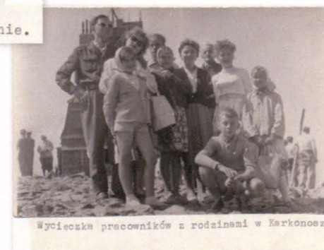
Wycieczka pracowników z rodzinami w Karkonosz

Odpoczynek po pracy zapewniała mu działka przy ulicy Sudeckiej. To tam