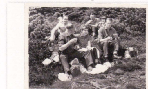
Wycieczki księgarskie w góry i na wiśnie.

Księgarstwo było zdecydowanie największą z jego pasji, ale nie jedyną. Uwielbiał podróżować, organizował liczne wycieczki po Kotlinie Jeleniogórskiej i innych zakątkach kraju. W jego wyprawach brali udział znajomi, rodzina, a także koledzy księgarze z innych miejscowości. W 1978 roku w czasie podróży do Anglii spotkał przybyłego właśnie z odległego rejsu do Plymouth wielkiego polskiego podróżnika Krzysztofa Baranowskiego.