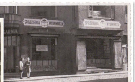
Budynek księgarni "Wiedza" później "Książka i Wiedza" a od 1950 "Dom Książki" 1 Maja 10.

Od 1949 roku pracował już w księgarni Spółdzielczej „Książka i Wiedza” przy ulicy 1-go Maja 10 w Jeleniej Górze. Ciągłe się doksztalał i jako jeden z pierwszych w Polsce ukończył w 1957 roku Technikum Księgarskie w Poznaniu i na resztę swojego zawodowego życia związał się z Jelenią Górą. To właśnie w tym miejscu, narodził się jeleniogórski „Dom Książki” (1950) oraz Klub Księgarza (1959).