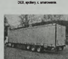
'88 TRAILOR linna, 3 osie SMO, poduszki, cł. podnoszona, rozsuwane bolid i dach, koź. na palety, wym.: 13,83 x 2,47 x 2,68 m, na 34 palety, ład. 29 t, ABS, z tyłu duże drzwi.