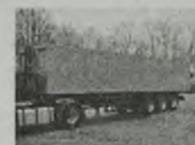
'85 STAB 3 osie SAF, poduszki, całokł. aluminiowy, ABS, c. smarowanie, wym.: (11,50 x 2,48 x 1,93) m, poj. 56 m3, ład. 26,5 t, z tyłu drzwi, stan bdb.