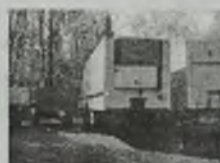
'88 KOEGLER chłodnia, 3 osie, poduszki, cł. podnoszona, og. opal. elek. CARRIER MAXIMA, koź. na palety, wym.: (13,40 x 2,47 x 2,83) m, ład. 26,5 tony, ABS, stan bdb.