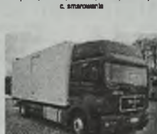
'87 MAN 18.343 GLOBE, izoterma z ogrzewaniem, poduszki, ABS, winde pod ramę, zaczep do przyczepy, przab. 600 tys. km, wym.: 7,2 x 2,42 x 2,36 m, ład. 8 t, zaczep do przyczepy, przab. 800 tys. km.