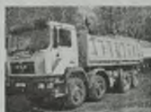
'82 MAN 32.372 3-osi, wywrot. MEILLER-a, 4 osie, napęd 6x4, 2 osie sztywne, EURO 1, 370 KM, zaczep do przyczepy, pianka, opona przeciwbieżna, przab. 400 tys. km, bezwypadkowy, stan bdb.