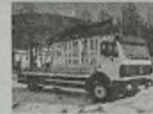
'89 MERCEDES 19-24 specjalizowany do przewożenia asfaltu i HDS-ami, PALFINGER PK 10500, składowy w Z", poduszki, EURO 2, L-pakiet, 240 KM, d. 8,7 m, ład. 6 t.