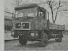
'88 MAN 17.253 3-osi, wywrot. MEILLER-a, napęd 4x4, EURO 1, 230 KM, d. 4,6 m, ład. 8,2 t, opona przeciwbieżna, przab. 235 tys. km, zaczep do przyczepy, bezwypadkowy.