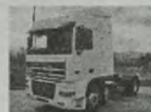
'88 DAF XF 430 SPACE CAB EURO 2, L-pakiet, 430 KM, webasto, klimat., DEB, spalanie, c. smarowanie.