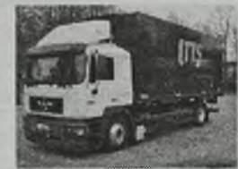
'88 MAN 18.343 F-2808 Bof bezbarwna z ogrzewaniem, kab. COMMANDER, EURO 2, L-pakiet, 340 KM, cł. podnoszący, klimat., ABS, webasto, blokada mostu, sztyberdach, c. smarowanie, z tyłu drzwi - 10.800 zł lub zamienie na VW Transportera T4, uszkodzony Wrocław, tel. 0600/93-58-48