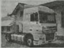
'91 DAF XF 430 SPACE CAB EURO 2, L-pakiet, 430 KM, webasto klimat., DEB, przab. 340 tys. km, spalanie, c. smarowanie.