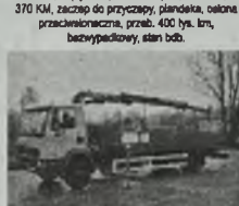
'87 DAF AE 86 12-180 skrzyniowy z HDS-ami PALFINGER PK 7000, zakabiny, składowy w Z", poduszki, EURO 2, L-pakiet, 180 KM, ABS, d. 8,76 m, DMC-12 km, ład. 6 t.