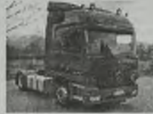
'89 MERCEDES ACTROS 18-43 GLOBE MEGA, elekto 1m, regulowana, poduszki, EURO 2, L-pakiet, 430 KM klimat., ABS, ASR, przab. 650 tys. km.