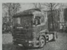
'88 SCANIA 144 L 480 EURO 2, L-pakiet, 480 KM, Retarder, klimat., webasto, c. smarowanie.