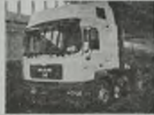
'91 MAN 18.414 F-2006 GLOBE EURO 2, L-pakiet, 410 KM, klimat., c. smarowanie, blokada mostu, przab. 430 tys. km.