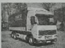
'87 VOLVO FH 12 389 GLOBETROTTER skrzynia piankowa Bof, Rf2, cł. podnoszona, poduszki, EURO 2, L-pakiet, 380 KM, klimat., webasto, hamulec górski - VEB, d. 7,04 m, ład. 13 t, przab. 800 tys. km.