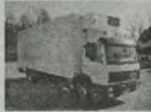
'88 MERCEDES 15-17 chłodnia, og. opal. niest. THERMOKING, EURO 2, L-pakiet, 170 KM, ład. 8,9 t, d. 7,45 m, winde, poduszki, przab. 440 tys. km.