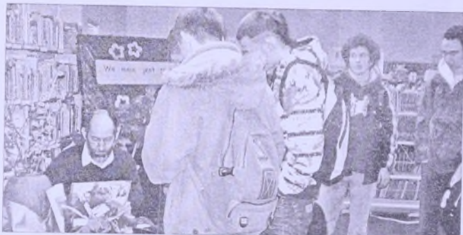
Podczas rozdawania autografów

W Miejskiej i Gminnej Bibliotece Publicznej w Wołowie gościł aktor Teatru Polskiego z Poznania Zbigniew Walerysiem.