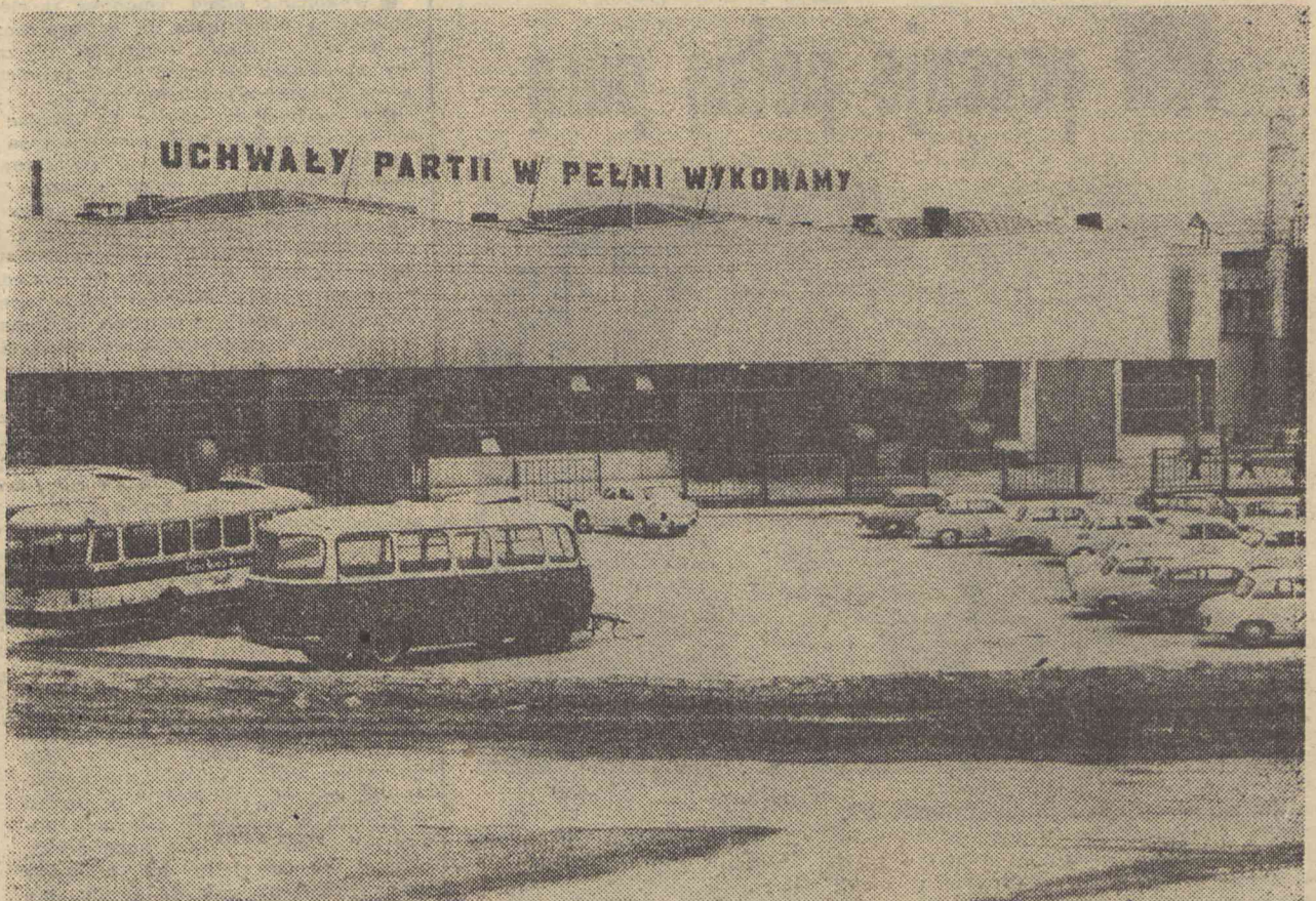
Parąg przed głównym wejściem do Zakładów Kuzienniczych i Maszyn Rolniczych.

W wyniku poczynionych starań otrzymaliśmy 504 oferty od osób, które wyraziły zgodę na podjęcie pracy w Zakładach Kuzienniczych. Wykorzystanie nadesłanych zgłoszeń jest jednak stosunkowo niskie ze względu na brak możliwości zakwaterowania werbowanych