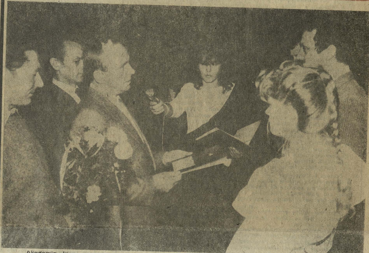
Akademia, która odbyła się w zakładzie z okazji 40-lecia istnienia ZSZ była okazją do podsumowania działalności i wyników szkoły w minionym ćwierćwieczu.

Za swą działalność dydaktyczno-wychowawczą szkoła została odznaczona odznaką „Zasłużony dla ZWCh Chemitex-Celwiskoza”.