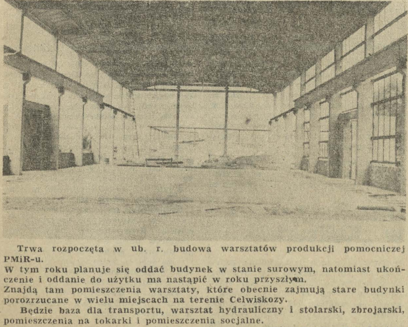
Trwa rozpoczęta w ub. r. budowa warsztatów produkcji pomocniczej PMIR-u. W tym roku planuje się oddać budynek w stanie surowym, natomiast ukończenie i oddanie do użytku ma nastąpić w roku przyszłym. Znajdą tam pomieszczenia warsztatowe, które obecnie zajmują stare budynki porzucane w wielu miejscach na terenie Celwokozy.

misji rozpatrującej przydziały mieszkań. Postulat: Włączyć laboratorium energochemiczne do Działu Głównego Specjalisty Energetyka oraz przyznać laborantkom II tab. tak jak mają pracownicy elektrociepłowni. Przyznać premię za oszczędności paliw i energii laborantkom. Odpowiedź: W najbliższym okresie zostanie definitywnie rozwiązany problem włączenia laboratorium energochemicznego do Działu Gł. Sp. Energetyka lub do Laboratorium Analitycznego. Jeżeli są oszczędności paliw laborantki również otrzymują premię z tego tytułu. Postulat: Przyznać dodatek za pracę szczególnie niebezpieczną przy urzędzeniach wysokiego napięcia brygadzom urządzeń stacyjnych oraz za bezpieczeństwo i automatyki zgodnie z uchwałą nr 127/79 Rady Ministrów z dnia 17.08.1979 r. Odpowiedź: W Monitorze Polskim nie zamieszczono Uchwały nr 127/79. Układ Zbiorowy Pracy dla Przemysłu Chemicznego nie przewiduje takiego dodatku, w związku z czym brak jest podstaw do jego stosowania. Z informacji posiadanych wynika, że Komisja Rządowa pracuje nad takimi dodatkami.