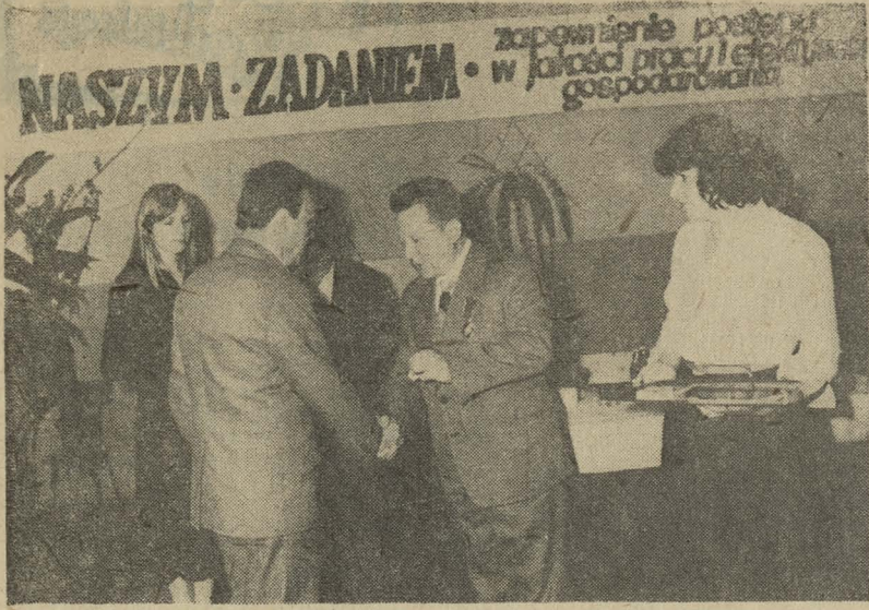
Przeds. Moderni, i Rem, w Jeleniej Górze podlegają oddziały terenowe w Szczecinie, we Wrocławiu, Łodzi, Tomaszowie Mazowieckim...