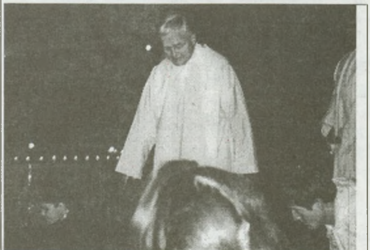
O Europejskim Spotkaniu Młodych w Budapeszcie i oje Ragerze relacja naszych wysłanników na str. 4