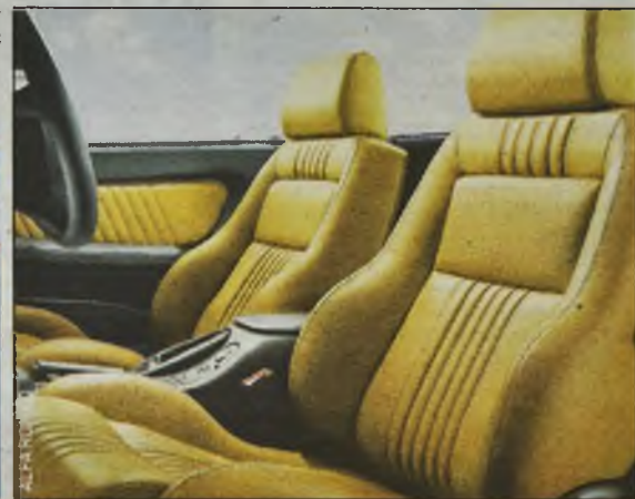
Doskonale wyprofilowane, skórzane fotele. Aż chce się usiąść