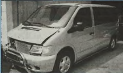
MB Vito F CDI 2002r. automatic, klimatyzacja, vobasto, tempomat, pełna elektryka, wszystkie poduszki o.k., alu. felgi cena na telefon