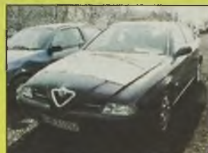
ALFA ROMEO 166 , 1999/00 r., 2500 ccm, V6, 24V, granatowy, lekko nadpalony osprzęt silnika, pełne wyposażenie oprócz skorzonej tapicerki, kupiony w kraju w salonie, 1 rejestracja i kupno w 2000 r., niski koszt naprawy, - 48.000 zł.