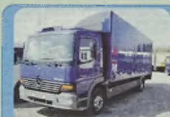
MERCEDES ATEGO 1217, 1223 roczniki 1998, 1999, 2000, Euro II, 170 KM, 230 KM, ABS, ASR, do wyboru plandeka, kontener.