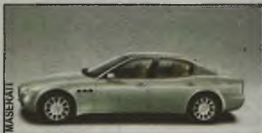
Nienaganna linia luksusu

Crossfire - koncepcyjny model firmy Chrysler został uznany przez polską edycję magazynu Playboy sa-