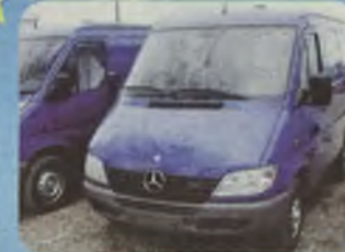
MERCEDES SPRINTER 211 CDI, 2001/02 r. silnik 110 KM, ścianka działowa, częściowo przeszklone, ABS, ABD, EBV, SRS.