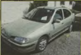
RENAULT MEGANE CLASSIC, 1998 r., 90 tys. km, 1600 ccm, benzyna, szary metalik, poduszka pow., wspomaganie kier., ABS, alum. immobilizator, centr. zamek, el. ow. szyby, el. reg. lusterek, reg. kierownica, dzielone tyłne siedzenie, el. ow. szyby, opony Michelin 175/14, stan b. dobry, i wstydzieli, - 29.900 zł. F2603893