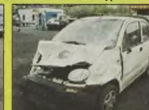
DAEWOO MATIZ FRIEND VAN , 2000 r. uszkodzony prawy przód, przycięciony dach, - 10.800 zł możliwość wystawienia faktury VAT.