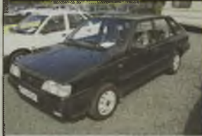
POLONEZ CARD, 1994 r., 87 tys. km, 1600 ccm, benzyna, inst. gra., graficzny metalik, wspomaganie kier., ABS, centr. zamek, el. ow. lusterek, el. ow. szyby, dzielone tyłne siedzenie, obrótmiernik, zegar, dzielone operacje tyłne, - 4.690 zł. F2603863