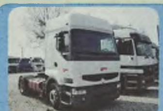
RENAULT PREMIUM GLOBETROTTER, 1998/99 r. Euro II, Pakiet L, zawieszenie pneumatyczne, ABS, ASR, ogrzewanie webasto, kabina sypialna maksymalnie wyposażona.