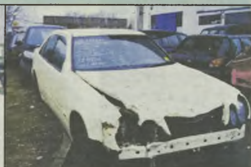
MB E 200 CDI 6/2000r. automatic, wszystkie poduszki o.k., klimatyzacja, 160 tys. km. ks. serwisowa, tempomat 9.900 euro