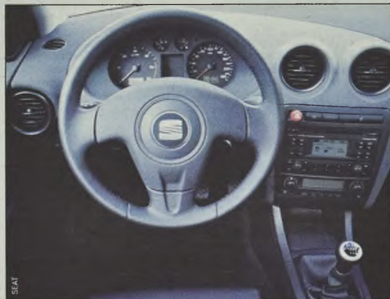
Uporządkowana deska rozdzielcza może się spodobać