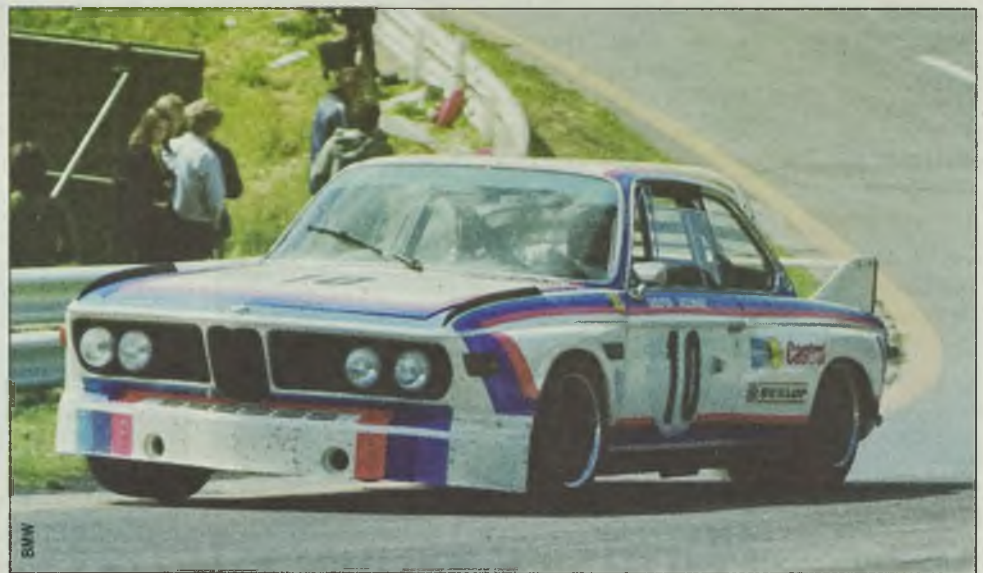
Legendarne BMW 3.0 CSL. Od niego zaczęła się historia BMW Motorsport