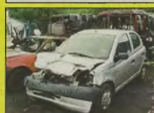
TOYOTA YARIS , 2001 r., 1000 ccm, VVT-i, srebrny, uszkodzony przód, kupiony w salonie, 1 właściciel, klimatyzacja, RO oryginalny, centralny zamek, poduszka pow., kpl. dokumentacja, zarejestrowany, - 23.000 zł.