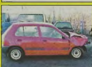
TOYOTA STARLET XLI , 1998 r., 1300 ccm, czerwony, alarm, wtrysk elektroniczny, uszkodzony niegroźnie przód, podłużnice i zderzak nienaruszone, wcześniej bez wypadku, kupiony w salonie, „twardy” dowód, kpl. dokumentacja, - 11.700 zł.