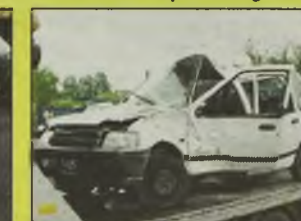
DAEWOO TICO SX , 1998 r., biały, uszkodzony lewy bok, 1 właściciel, el. otw. szyby, centralny zamek, zarejestrowany, - 5.900 zł.