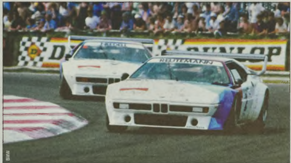
Model M1 na trasie wyścigu