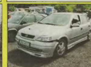
OPEL ASTRA II ELEGANCE , 1999 r., 1800 ccm, 16V, srebrny, najbogatsza wersja, klimatyzacja, pełne wyposażenie el., ABS, alum. felgi, RO oryginalny, drewniane dodatki, spoiler, atrak. wygląd, 1 właściciel, z salonu, uszkodzony tył, kpl. dokumentacja, - 31.000 zł.