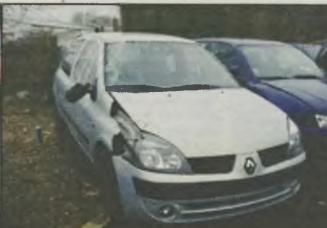
Renault Clio 1.5 DCI 6/02r. klimatyzacja, boczna poduszka otwarta, el. szyby, lusterka, komputer 5.900 euro