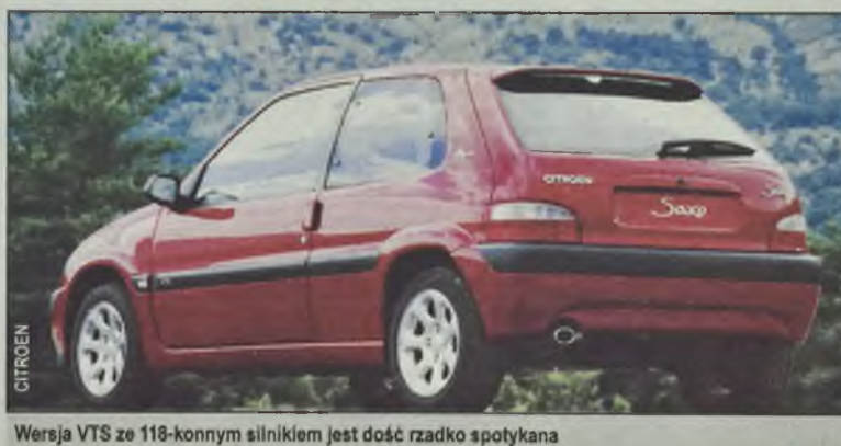
Wersja VTS ze 118-konnym silnikiem jest dość rzadko spotykana

O ile konstrukcyjnie Saxo bardzo przypomina Peugeota 106, ma jednak odmienny wygląd. Nadwozie jest proporcjonalne i optycznie