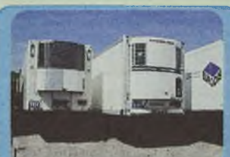
NACZEPY CHŁODNIE SCHMITZ, KOEGEL, 1996 r. roczniki 1996, agregaty Carrier Maxima i Thermo King SMX, 3 osie, ład. 24 t