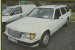
MERCEDES 300 124 D, 1988 r., 143 tys. km, turbo D, biały, granatowy metalik, wspomaganie kier., immobilizator, el. ow. szyby i reflektory, el. reg. lusterek, RO, halogeny, pilot automatyczny, reflektory deszczowe, alum. felgi, szeroka listwa boczna, oddzielne zapłon, opony Debica 195/15, - 27.600 zł. F2603823