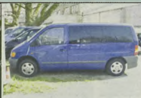
MB Vito 113 L (Gaz, butla -140 l.) 129KM 8/00r. 9-o osobowy, 2x airbag, abs, alu. felgi, hak, centralny zamek 10.900 euro netto