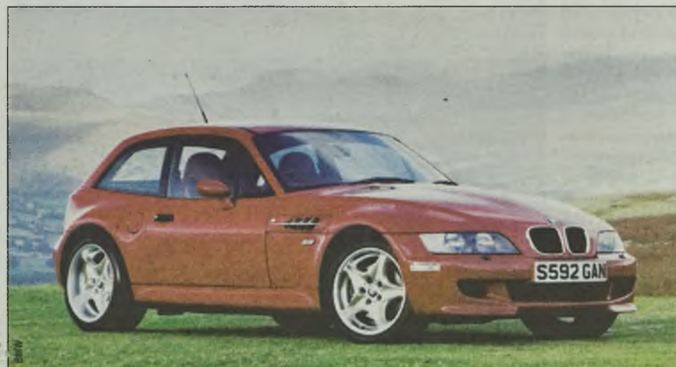
BMW M Roadster pozytywnie zaskakuje długą maską