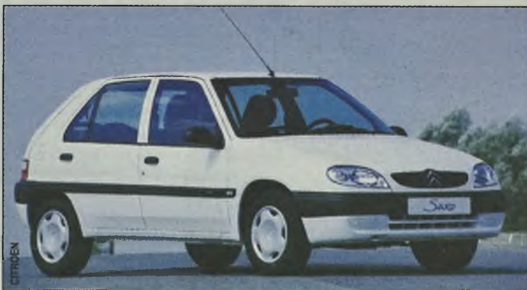
Pięciodrzwiowa wersja może być dobrym rozwiązaniem dla czteroosobowej rodziny