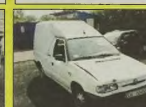
SKODA FELICIA PICK-UP , 1998 r., 1900 ccm, diesel, biały, bardzo delikatnie uszkodzony narożnik, techn. sprawny, niski koszt naprawy - 800 zł, - 12.500 zł możliwość wystawienia faktury VAT.