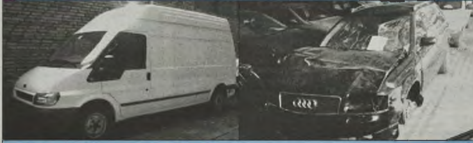
Ford Transit 2,8 TD 85T 300 2003r. 2x airbag, serwo, ABS