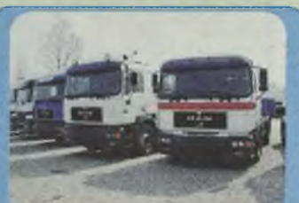
MAN 18.403, 1997/98 r. ciągniki siodłowe, 400 KM, Euro II, ASR, blokada mostu, zawieszenie pneumatyczne, ABS, ASR, ogrzewanie Webasto, kabina sypialna.