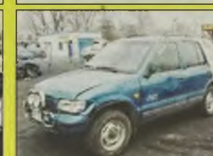
KIA SPORTAGE MR , 1998/01 r., 22 tys. km, 2000 ccm, 16V, DOC, morski metalic, uszkodzony delikatnie tylny narożnik i przednia lampa, wspomaganie kier., centralny zamek, el. reg. lusterka, el. otw. szyby, 4x4, RO, orurowany, relingi dachowe, halogeny, serwisowany, 1 rejestracja i zakup w salonie w 2001 r., 1 właściciel, kpl. dokumentacja - 29.900 zł.