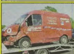
FORD TRANSIT , 1996 r., 2500 ccm, diesel, czerwony, uszkodzony niegroźnie przód, z salonu, 3-osobowy, zarejestrowany, - 15.800 zł.