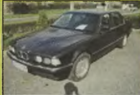
BMW 738 i, 1992 r., 210 tys. km, 3400 ccm, benzyna, czarna, metalik, wspomaganie kier., ABS, centr. zamek, el. reg. lusterek, el. ow. szyby, el. reg. reflektory, komputer, alum. felgi, halogeny, kasek na narty, opony zimowe Pirelli 225/16, wsłuchowa tapicerka (szara), - 18.990 zł. F2603763