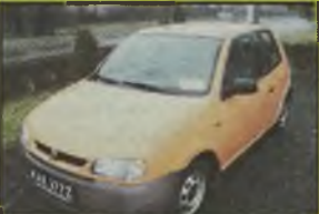
SEAT AROSA, 1996 r., 1000 ccm, benzyna, lososinowy, blokada skrzyż. biegów, obrótmiernik, RO, el. reg. lusterek, el. ow. szyby, kolpaki, RO, oznakowany, dzielone tyłne operacje, opony Debica 155/13, - 19.900 zł. F2603903