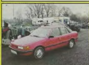
MITSUBISHI LANGER GLX , 1992 r., 1500 ccm, wtrysk, czerwony, uszkodzony komputer, bez wypadku, - 7.300 zł.