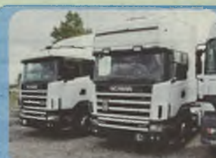
SCANIA 124 L, 1998 r. ciągniki siodłowe, 400 KM, Euro II, ABS, ASR, zawieszenie pneumatyczne, ogrzewanie webasto, retarder, komfortowa kabina.