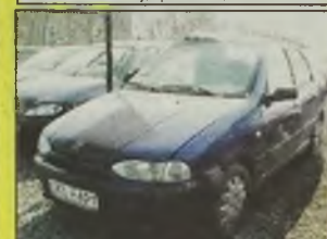
FIAT SIENA , 1998 r., 1400 ccm, benzyna, inst. gaz., granatowy, kupiony w salonie, 1 właściciel, kpl. dokumentacja, „twardy” dowód, - 11.800 zł.