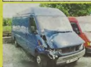
MERCEDES SPRINTER 308 D , 1998 r., niebieski, długi, wysoki, kupiony w salonie, uszkodzony prawy i lewy narożnik, silnik sprawny, kpl. dokumentacja, zarejestrowany, - 31.500 zł.