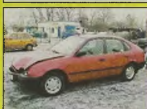
TOYOTA COROLLA , 1999 r., 85 tys. km, 1300 ccm, czerwony, liftback, wersja Linnea Terra, 5-drzwiowy, z salonu, serwisowany, el. otw. szyby, el. reg. lusterka, wspomaganie kier., centralny zamek, uszkodzony delikatnie przód, kpl. dokumentacja, zadbany - 21.400 zł oraz Corolla, 1998 r., uszkodzony - 16.500 zł.