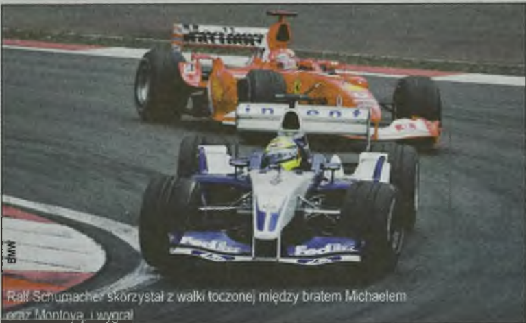
Ralf Schumacher skorzystał z walki toczony między bratem Michaeliem i Montoyą i wygrał