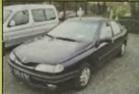
RENAULT LAGUNA, 1997 r., 83 tys. km, 2200 ccm, diesel, granatowy metalik, wspomaganie kier., immobilizator, el. ow. szyby i reflektory, el. reg. lusterek, RO, halogeny, pilot automatyczny, reflektory deszczowe, alum. felgi, szeroka listwa boczna, oddzielne zapłon, opony Debica 185/14, - 29.990 zł. F2603883