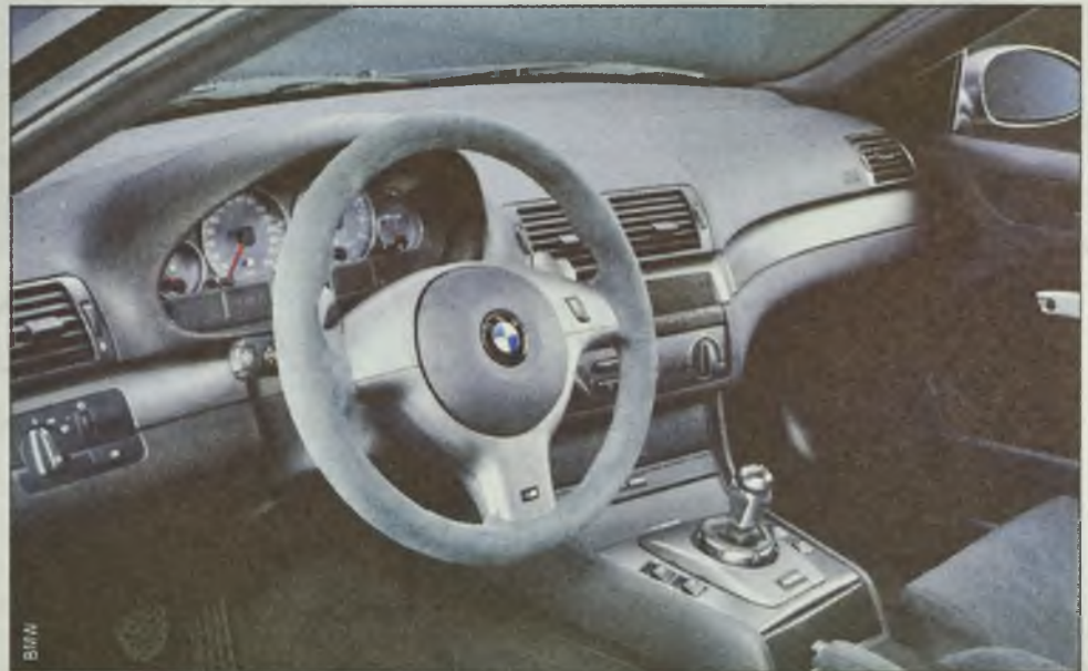
Wnętrze modelu M3 CSL z 2003 roku przypomina raczej luksusowe samochody