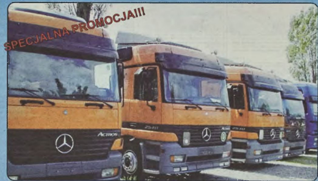
MERCEDES 2540 ACTROS GLOBETROTTER, MEGA BDF, 1997/98 r. Euro II, Pakiet L, 400 KM, 3 osie, oś podwieszana, zawieszenie pneumatyczne, ABS, ASR, ogrzewanie Webasto, tempomat, kabina sypialna maks. wyposażona, hak, ład. 14 t, do wyboru kontener, plandeka, chłodnia wymiary 7.20 x 2.45 m.

80-298 Gdańsk, ul. Słowackiego róg Budowlanych