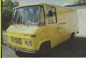
MERCEDES 407, 1979 r., 73 tys. km, 2400 ccm, diesel, bity, białozłoty, błyszcząca kolia tył, dł. 3 m, szer. 1,85 m, wys. 1,85 m, drzwi tyłne wsłuchowe, RO, opony Stomil 6,50/16, drzwi przesuwane, - 5.990 zł. F2603943