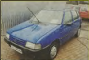
FIAT UNO, 1996 r., 60 tys. km, 1700 ccm, diesel, niebieski, alum. inst. radiowa, zegar, listwy boczne, oddzielne zapłon, opony przednie Komoran, tyłne imbius 155/70/13, - 11.900 zł. F2603783