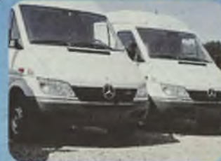
MERCEDES SPRINTER 211, 213, 311, 313 CDI, 2000/01 r. MAXI, ścianka działowa, ABS, ASR, ABD, ład. ok. 1.5 t