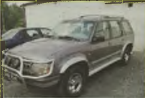
FORD EXPLORER, 1996 r., 166 tys. km, 4000 ccm, benzyna, szaro-wirszowy metalik, 4x4, automat, klimatyzacja, wspomaganie kier., ABS, centr. zamek, dzielone tyłne siedzenie, el. ow. szyby, el. reg. lusterek, el. ow. fotela, RO, el. ow. dach, skórzana tapicerka, reg. wys. pasów, halogeny, orurowany, opony Firestone 255/16, - 42.900 zł. F2603973

bez kosztów, - możliwość ekspozycji w ogrzanych halach - ekup i bezpłatny komis przy czep kempingowych, bagażowych i innych.