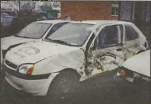
Ford Fiesta 1,3 37KW 5/01r. poduszki o.k. 3.700 euro