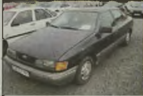
FORD SCORPIO Ghia, 1986 r., 144 tys. km, 2800 ccm, benzyna, inst. gra., graficzny metalik, wspomaganie kier., ABS, centr. zamek, el. ow. lusterek, el. ow. szyby, dzielone tyłne siedzenie, wsłuchowa tapicerka, el. ow. dach, obrótmiernik, spoiler, inst. radiowa, dodatkowy komplet opon, - 6.990 zł. F2603803