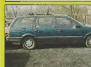
VW PASSAT KOMBI , 1992/93 r., 2000 ccm, zielony, wersja Variant, wspomaganie kier., szyberdach, ABS, relingi dachowe, techn. sprawny, do drobnych poprawek kosmetycznych, - 11.800 zł.