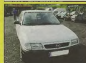
OPEL ASTRA GL , 1998 r., 1400 ccm, biały, uszkodzony delikatnie tył, techn. sprawny, poduszka pow., centralny zamek, alarm, z salonu, - 18.300 zł.