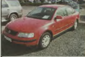
VW PASSAT, 1998 r., 10 tys. km, 1900 ccm, TDI, czarny, alum. hak, 2 poduszki pow., ABS, blokada skrzyż. biegów, immobilizator, centr. zamek, el. ow. lusterek, el. ow. szyby, klimatyzacja, RO, dzielone operacje, wsłuchowa tapicerka (czarno-szława), opony zimowe Fulda 185/65/15, - 45.900 zł. F2603923