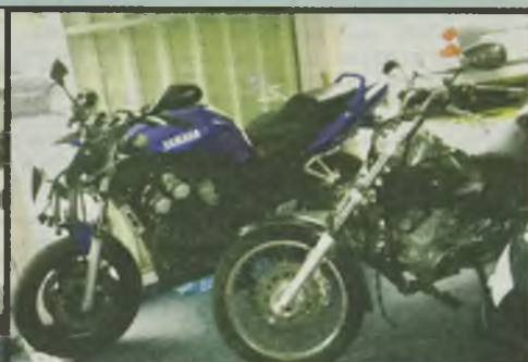
Yamaha 125 "Drag Star" 2000r 8.600 km. Yamaha 600 70 KW 5/2002r