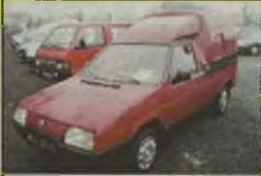
SKODA FAVORIT PICK-UP, 1993 r., 68 tys. km, 1300 ccm, benzyna, bordowy, inst. radiowa, kasetnik świetlny, zegar, kolpaki, tapicerka białowa, 2-osobowy + 500 kg, 2-akrydowe drzwi tyłne, opony przednie letnie 165/70/13, tyłne zimowe Stomil 175/70/13, przegląd do 10.2003 r., - 3.990 zł. F2603953