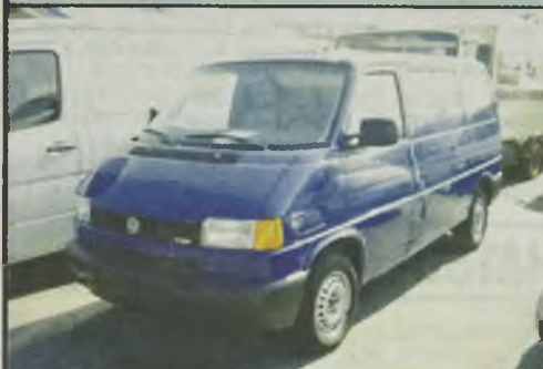
VW T4 2.5 Tdi 12/99r. 160 tys. km., 1-a ręka, immobiliser, serwo 8.500 euro netto