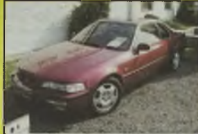
HONDA LEGEND COUPE, 1985 r., 205 tys. km, 3200 ccm, benzyna, bordowy metalik, skórzana tapicerka, 2 poduszki pow., wspomaganie kier., ABS, TCS, klimatyzacja, el. ow. szyby, el. reg. lusterek (podgrzewane), el. reg. i podgrzewane fotela z pamięcią i szyberdach, alum. felgi, pilot automatyczny, reg. kierownica, halogeny, RO, CD centralny zamek, alum. hak, - 55.990 zł. F2603813