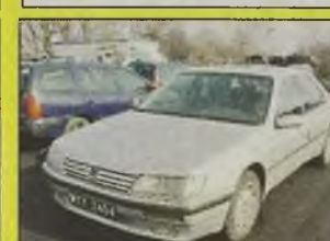
PEUGEOT 605 SV , 1990 r., 3000 ccm, srebrny metalic, stan b. dobry, pełne wyposażenie el., ABS, wspomaganie kier., szyberdach, RO, alarm, bez wypadku, kpl. dokumentacja, zarejestrowany, do wymiany uszczelka pod głowicą, - 9.900 zł.