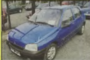
RENAULT CLIO, 1996 r., 60 tys. km, 1200 ccm, benzyna, granatowy metalik, zegar, inst. radiowa, reg. wys. pasów, tapicerka materiałowa (niebiesko-szara), dzielone operacje, zagłówki tyłne, dodatkowe światła „stop”, listwy ozdobne, opony Debica/Michelin, przegląd do 02.02.04 r., - 12.990 zł. F2603873