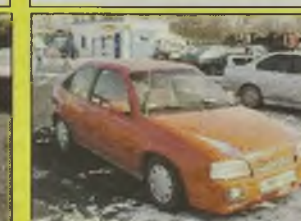
OPEL KADETT GSI , 1988 r., 1800 ccm, wtrysk, czerwony, wersja sportowa, deska Digital, spoiler, ciemne lampy, zderzaki i lusterka w kolorze nadwozia, stan dobry - 4.950 zł oraz Kadett 1600 D, 1988 r., uszkodzony pasek rozrządu - 4.700 zł.