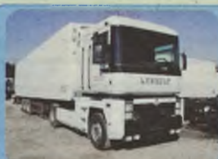
RENAULT MAGNUM 430, 1998/99 r. Euro II, Pakiet L, zawieszenie pneumatyczne, ABS, ASR, ogrzewanie webasto, kabina sypialna maks. wyposażona.