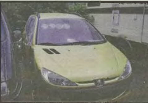
Peugeot 206 2.0L Sport Kombi 10/02r. 5 tys. km., klimatronic, serwo, pełna el., 4x airbag, alu. felgi, światła przeciwmgielne, sportowy pakiet wyposażenia, lekko uszk. bok, cena nowego 21.900 euro 8.950 euro