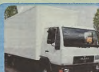
MANY 8.163, 1999 r. kontener + winda, 6.20 x 2.45 m, Euro II, 160 KM, kabina dzienna, ład. ok. 3 t.