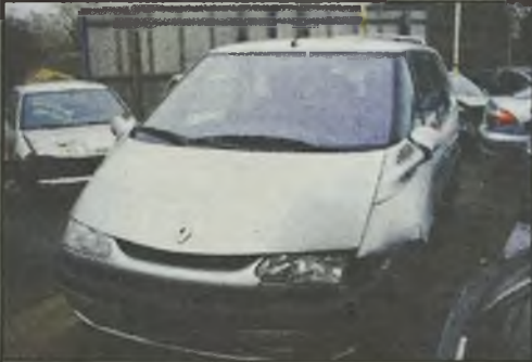
Renault Grand Espace 2,2 DCI 12/2000r. jeżdżi, webasto, 41 tys. km., klimatronic, hak 10.900 euro