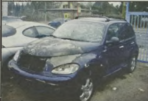
Chrysler PT Cruiser Diesel 2,2 CDR 5/02r., 5-o biegowy, skóra, klimatyzacja, spalony przód, 10 tys. km 7.900 euro