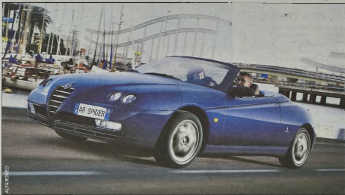
GTV i Spider: nowa odsłona

Nie wiadomo jeszcze, kiedy auto będzie dostępne w polskich salonach. Na pewno jednak skusi wszystkich tych, którzy poważnie zastanawiają się nad kupnem pojazdu osobowo-użytkowego.