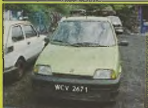
FIAT CINQUECENTO YOUNG , 1997/98 r., 700 ccm, oliwkowy metalic, stan dobry, do wymiany uszczelka pod głowicą, zarejestrowany, kpl. dokumentacja, - 6.300 zł.