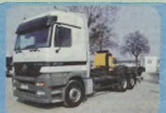
MERCEDES 2540 ACTROS GLOBETROTTER, MEGA SPACE BDF, roczniki 1997/1998, Euro II, Pakiet L, 400 KM, 3 osie, oś podwieszana, zawieszenie pneumatyczne, ABS, ASR, ogrzewanie webasto, tempomat, kabina sypialna maks. wyposażona, hak, ład. ok. 14 t, do wyboru plandeka, chłodnia, 7.20 x 2.45 m.