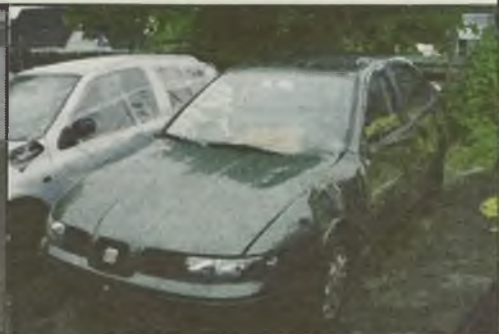
Seat Toledo 1,9 TDi 110KM 10/2002r. 3.500 km., 1-a boczna poduszka otwarta, 3 x o.k., klimatronic, pełna el. 8.900 euro