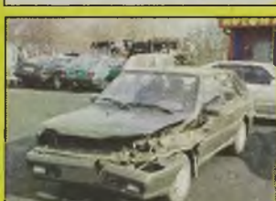
POLONEZ CARO PLUS , 1997 r., 1600 ccm, GLI, miodowy metalic, uszkodzony prawy przód, silnik sprawny, kpl. dokumentacja, zarejestrowany - 6.400 zł, Polonez Caro GLI, 1996 r., zielony, techn. sprawny, uszkodzone drzwi tylne - 4.600 zł.