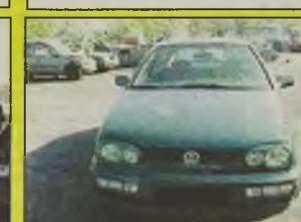
VW GOLF III , 1996 r., 1600 ccm, zielony metalic, alum. felgi, poduszka pow., centralny zamek, alarm, szyberdach, atrak. wygląd, - 19.900 zł.

Prowadzimy skup aut uszkodzonych za gotówkę, tel. 0-601 217 542 lub 0-691 799 011