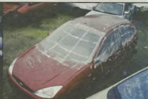
Ford Focus 1.6i 75KW 8/01r 1 tys. km.!!!, klimatyzacja, pełna el., ABS 5.100 euro