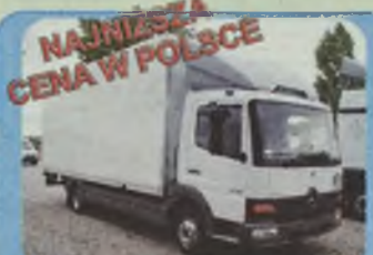
MERCEDES ATEGO 815, 1998/99 r. plandeka lub kontener + winda, 6.20 x 2.45 m, ład. ok. 3 t, grafitowe i białe, Euro II, Pakiet L, 150 KM, ABS, także możliwa kabina sypialna.