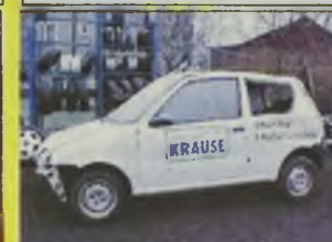
FIAT SEICENTO SPI VAN , 2001 r., 1100 ccm, biały, uszkodzony niegroźnie prawy przód i błotnik tylny, kpl. dokumentacja, wystawimy fakturę VAT - 11.500 zł brutto oraz Seicento van, 1999 r., lekko uszkodzony - 10.500 zł.