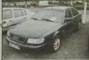
AUDI A8 C4, 1996 r., 14995 km, 2500 ccm, TDI, zielony metalik, el. ow. szyby, el. reg. lusterek, RO, zegar, poduszka pow., alarm, blokady skrzyż. biegów, centr. zamek, obrótmiernik, wsłuchowa tapicerka, wykończenie w drewno, szczerkowe reflektory, hak, reg. wys. fotela kierowcy, - 39.990 zł. F2603743