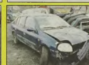
RENAULT THALIA SEDAN , 2001 r., 1400 ccm, granatowy, centralny zamek z pilotem, el. reg. lusterka, el. otw. szyby, alarm, uszkodzony przód, bogate wyposażenie, zarejestrowany, kpl. dokumentacja - 19.900 zł, Thalia, 2001 r. - 14.500 zł.