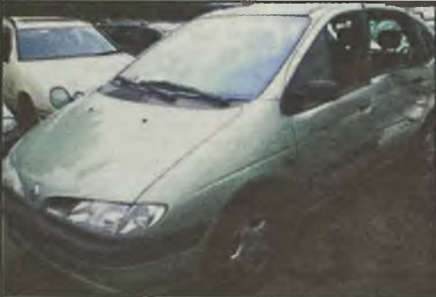
Renault Megane Scenic 1,6 16V instalacja gazowa 98r. klimatyzacja, 80 tys. km., lekko uszk. lewy bok, wszystkie poduszki całe 5.900 euro