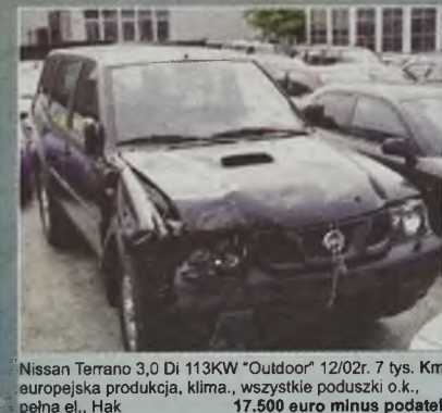
Nissan Terrano 3.0 Di 113KW "Outdoor" 12/02r. 7 tys. Km. europejska produkcja, klima., wszystkie poduszki o.k., pełna el., Hak 17.500 euro minus podatki

sprzedaż części pod adresem Holzstr. 12 13359 Berlin czynne pn.-pt. 8.00-18.00 tel. 0049 30 491 10 31 sobota 9.00-13.00 tel. 491 30 46