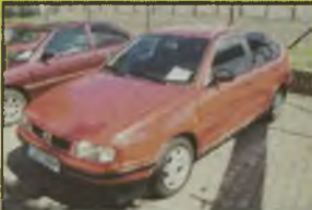
SEAT CORDOBA GLX, 1994 r., 68 tys. km, 1900 ccm, diesel, srebrny metalik, dzielone tyłne siedzenie, inst. radiowa, obrótmiernik, klimatyzacja, przyciemnione szyby, hak, RO, opony 185/60/14, - 18.990 zł. F2603913