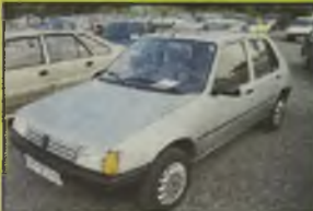
PEUGEOT 205 GRD, 1990 r., 64 tys. km, 1900 ccm, diesel, srebrny metalik, dzielone tyłne siedzenie, inst. radiowa, obrótmiernik, klimatyzacja, przyciemnione szyby, alum. felgi, alum. hak, opony Komoran 185/R13, - 7.990 zł. F2603853