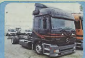
MERCEDES 1835, 1840 ACTROS GLOBETROTTER LOW-DECK, 1997/98 r. Euro II, Pakiet L, 400 KM i 310 KM, 2 osie, zawieszenie pneumatyczne, ABS, ASR, ogrzewanie webasto, kabina sypialna komfortowa, hak, ład. 8 t, zabudowy do wyboru: plandeka, kontener, chłodnia.