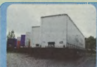
NACZEPY SCHMITZ, KOEGEL, KRONE chłodnie, Izotermi, fi-ranki, burtoplandek, roczniki 1996, 1997, 1998, 1999, 2000