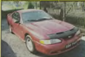
FORD MUSTANG, 1994 r., 147 tys. km, 3800 ccm, benzyna, białony, automat, centr. zamek, dzielone tyłne operacje, 2 poduszki pow., klimatyzacja, wspomaganie kier., el. ow. szyby, el. reg. lusterek, RO, alum. felgi, blokada Mi-L-Lock, opony 215/54 Goodyear, - 27.990 zł. F2603793