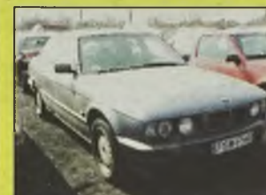
BMW 540iA , 1993 r., 4000 ccm, V8, E-34, szary metalic, alum. felgi, automatic, centralny zamek, el. reg. lusterka, el. otw. szyby, immobilizer, RO, wspomaganie kier., ABS, poduszka pow., szeroki grill bez wypadku, wymaga kosmetyki i poprawek, techn. sprawny, do jazdy, drewno, telefon komórkowy, kpl. dokum., - 20.900 zł.