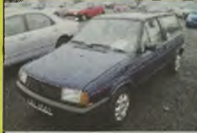
VW POLO FOX, 1991 r., 50 tys. km, 1300 ccm, benzyna, granatowy, RO, dzielone tyłne operacje, tapicerka materiałowa (szara w pasy), opony zimowe Debica/Komoran 145/13, - 9.990 zł. F2603933