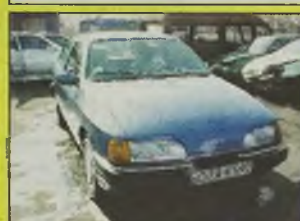
FORD SIERRA , 1988 r., 2000 ccm, wtrysk, niebieski metalic, delikatnie przerysowany bok, hak, szyberdach, techn. sprawny, zarejestrowany - 4.200 zł, SIERRA Laser, 2300 D, 1985 r., srebrny, uszkodzony delikatnie narożnik, techn. sprawny, centralny zamek, alarm, szyberdach, zarejestrowany - 2.900 zł.