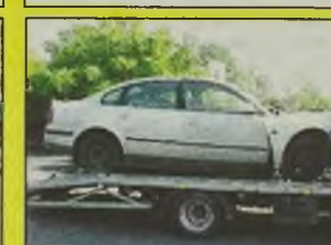
VW PASSAT B5 , 1998 r., 1800 ccm, srebrny, mocno uszkodzony lewy przód, kupiony w salonie, 1 właściciel, kpl. dokumentacja, - 26.900 zł.