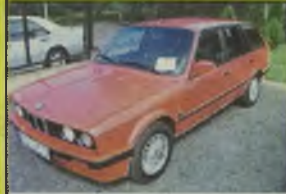
BMW 318 KOMBI, 1991 r., 100 tys. km, 1600 ccm, benzyna, czerwony, wspomaganie kier., ABS, centr. zamek, el. reg. lusterek, el. ow. szyby, reflektory, przyciemnione szyby, alum. felgi, wsłuchowa tapicerka, - 18.700 zł. F2603733