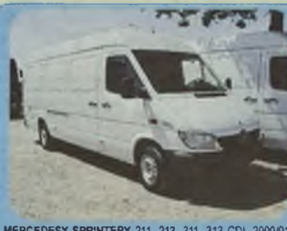
MERCEDES SPRINTER 211, 213, 311, 313 CDI, 2000/01 r. MAXI, ścianka działowa, ABS, ASR, ABD, ład. ok. 1.5 t