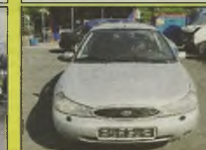
FORD MONDEO KOMBI Ghia, 1998 r., 2500 ccm, V6, srebrny, uszkodzony niegroźnie tył, techn. sprawny, z salonu, homologacja, b. bogate wyposażenie, klimatyzacja, ABS, TCS, drewno, pełne wyposażenie el., 2 poduszki pow., alarm, centralny zamek, alum. felgi, kpl. dokumentacja, - 27.900 zł.