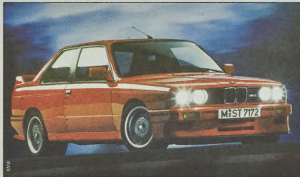
BMW M3 z 1988 roku: nadwozie do końca pozostało dwudrzwiowe