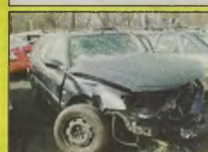
PEUGEOT 406 SR KOMBI , 2001 r., 1800 ccm, 16V uszkodzony lewy przód, bardzo bogate wyposażenie, kupiony w salonie w kraju, homologacja, - 25.500 zł.