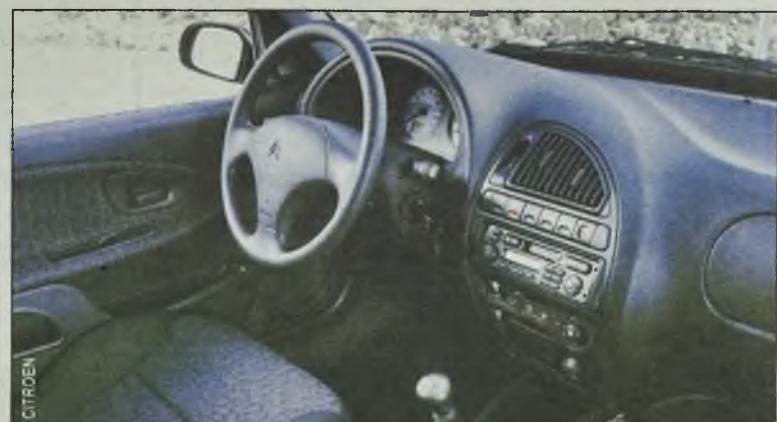
Jak na tę klasę, wnętrze wygląda zupełnie interesująco