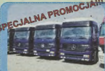
MERCEDES 1840 ACTROS GLOBETROTTER, 1997/98 r. Euro II, Pakiet L, 400 KM, 2 osie, kabina sypialna maks. wyposażona, półautomatyczna skrzynia biegów, zawieszenie pneumatyczne, ABS, ASR, ogrzewanie Webasto, tempomat.