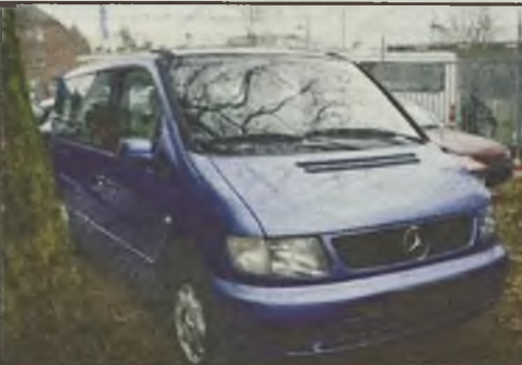
MB V 230 "Trend" TD 12/1996r. 72KW klimatyzacja, pełna el., 6-o osobowy, uszk. Silnik 8.900 euro