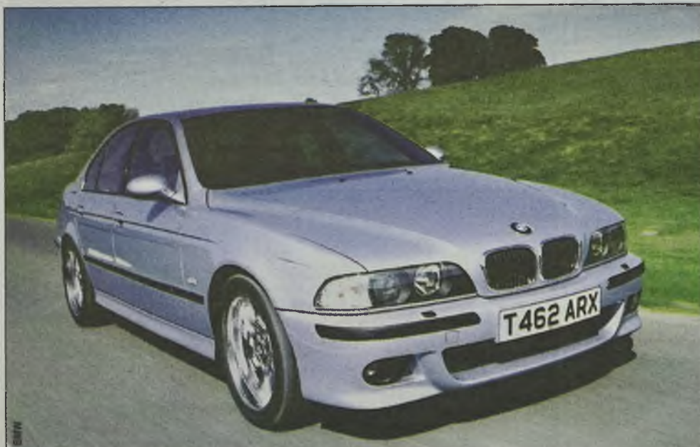
BMW M5 – limuzyna o ponadnormatywnych osiąгах. Czasami pozory mylą...

Osiągi modelu M1 rozochociły inżynierów z BMW do tego stop-