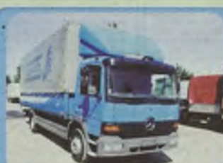
MERCEDES ATEGO 1217, 1223 roczniki 1998, 1999 i 2000, Euro II, 170 KM, 230 KM, ABS, ASR, do wyboru kontener, plandeka.