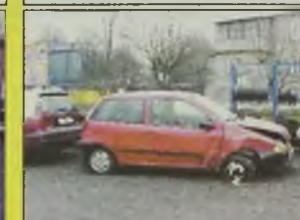
FIAT PUNTO , 1998 r., 1100 ccm, czerwony, lekko uszkodzony prawy przód, kupiony w salonie, kpl. dokumentacja, „twardy” dowód, - 12.700 zł.