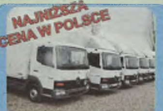
MERCEDES ATEGO 815, 1998/99 r. plandeka lub kontener + winda, 6.20 x 2.45 m, ład. ok. 3 t, kolory grafitowe i białe, Euro II, Pakiet L, 150 KM, ABS, także możliwa kabina sypialna.