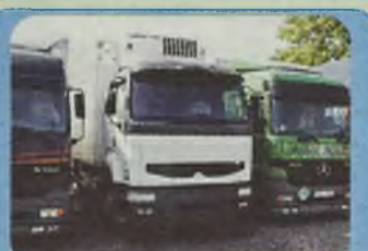
RENAULT PREMIUM chłodnia, agregat Thermo King, Euro II, Pakiet L, zawieszenie pneumatyczne, ABS, ASR, ogrzewanie Webasto, kabina sypialna maks. wyposażona