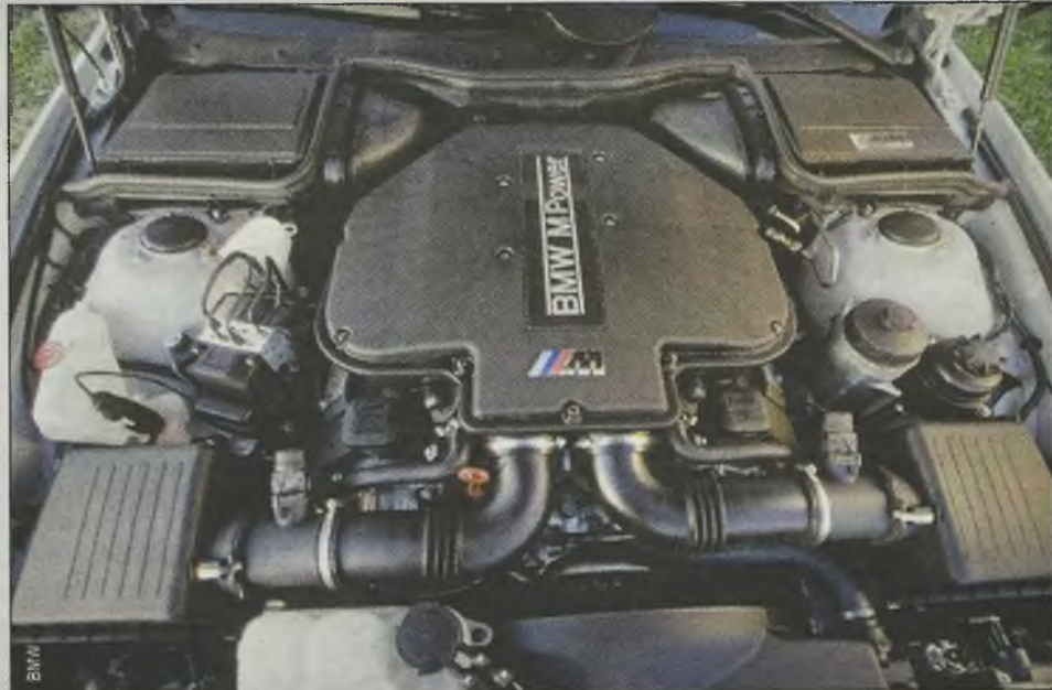
... a szczególnie wtedy, gdy pod maską znajduje się takie monstrum o mocy 400 KM