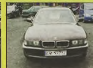
BMW 750iA , 1995/96 r., 5400 ccm, wtrysk, V12, E-36 wszystkie możliwe dodatki, uszkodzony silnik (możliwość założenia silnika ze skrzynią Tiptronic z 1999 r. w cenie auta), - 48.500 zł.