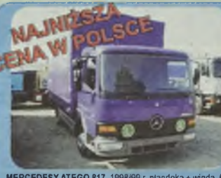
MERCEDES ATEGO 815, 1998/99 r. plandeka + winda, 6.20 x 2.45 m, ład. 3 t, kolory grafitowe i białe, Euro II, Pakiet L, 150 KM, ABS, także możliwa kabina sypialna.