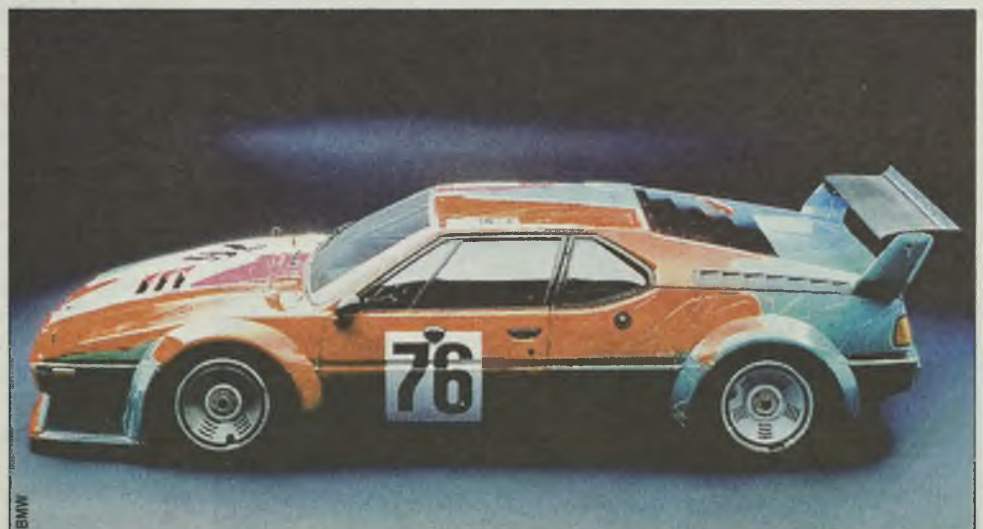
BMW M1 jako pożywka dla pop-artu - dzieło Andy Warhola