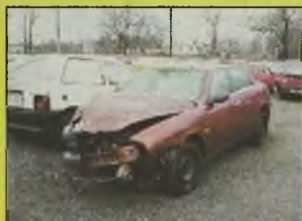
ALFA ROMEO 156 , 1998 r., 1600 ccm, 16V, Twin Spark, bordowy, kupiony w salonie, uszkodzony, klimatyzacja, inst. gazowa, - 20.800 zł.

Pełna oferta ze zdjęciami w internecie: www.palcars.gratka.pl