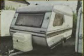
PRZYCZEPA KEMPINGOWA HOBBY, 1982 r., lodowka, zlewaczak, kuchnia gazowa, hamulec najazdowy, opony Tyntmaster, - 6.990 zł. F2603963