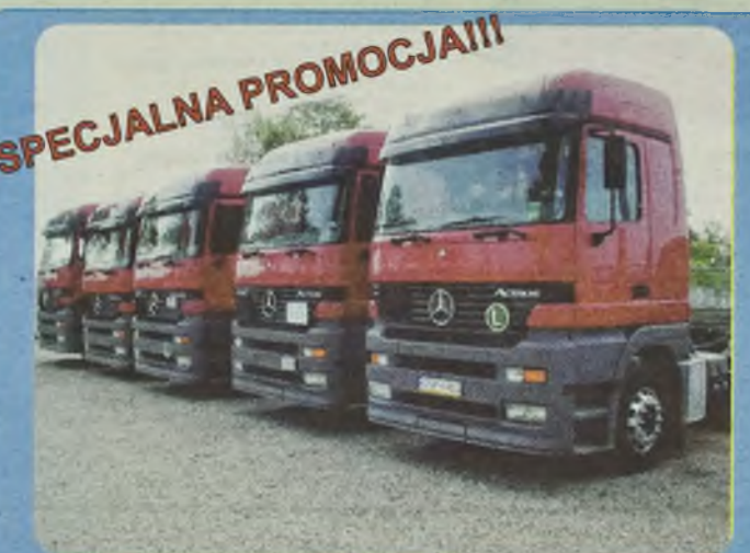
MERCEDES 1840 ACTROS GLOBETROTTER, MEGA SPACE, 1997/98 r. ciągniki siodłowe, Euro II, Pakiet L, 400 KM, 2 osie, zawieszenie pneumatyczne, ABS, ASR, ogrzewanie Webasto, tempomat, retarder, także przystosowane do ADR.