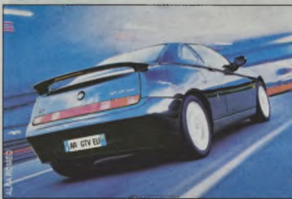
Wysoko uniesiony tył dodaje GTV dynamiki

Na koniec należałoby jeszcze dodać, że Maserati należy do grupy Ferrari. To chyba wystarczy za rekomendację.