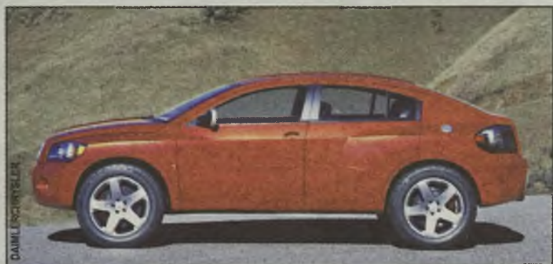
...z dość wysoko zawieszonym nadwoziem

Samochód został zaprezentowany na tegorocznej wystawie w Detroit. Nie wiadomo jeszcze, kiedy wejdzie do produkcji.