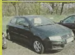
FIAT STILO ACTIVE , 2002 r., 3 tys. km, 1200 ccm, 16V lekko uszkodzony, techn. sprawny, używany 1 miesiąc, b. bogate wyposażenie, z salonu, - 34.500 zł w ofercie inne Fiaty.