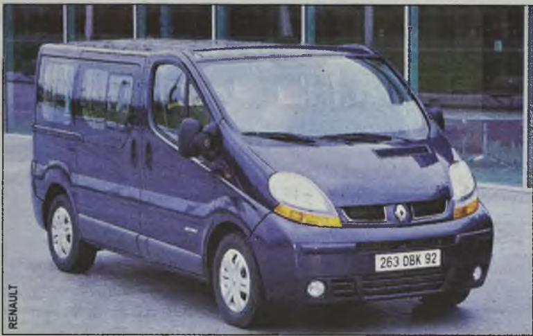
Renault Trafic Passenger