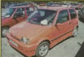
FIAT CINQUECENTO SPORTING, 1996 r., 56 tys. km, 1100 ccm, benzyna, czerwony, alum. centr. zamek, el. reg. lusterek, el. ow. szyby, RO, skórzana kierownica, owiane tył, zegar, obrótmiernik, przyciemnione szyby, uchwyty szyby tył, alum. felgi, oznakowany, pokrowiec, opony Michelin 165/13, - 10.660 zł. F2603773