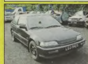
HONDA CIVIC , 1990 r., 1600 ccm, 16V, czarny, szyberdach, RO, blokada skrzyni biegów, techn. sprawny, zarejestrowany, - 7.900 zł.