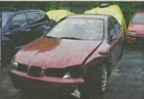
Seat Leon 1.9 Tdi 90KM 7/2000r. klimatronic, 1-y właściciel 50 tys. km. pełna el. 6.950 euro