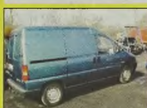
PEUGEOT EXPERT , 1999 r., 55 tys. km, 1900 ccm, TDI, niebieski metalic, uszkodzony lekko przód, el. otw. szyby, centralny zamek, wspomaganie kier., - 23.900 zł.