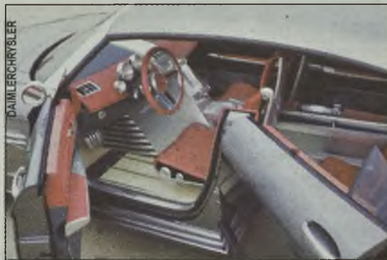
Drewno, aluminium i skóra: nic dodać, nic ująć

mochodem roku 2003. Crossfire to sportowe coupe zaprojektowane przez amerykańskich i niemieckich konstruktorów. Samochód ma być przeznaczony dla młodych aktywnych ludzi. Choć jego cena nie jest jeszcze znana, według kierownictwa firmy Chrysler oferta ta jest kierowana do osób zarabiających około 150 tys. USD rocznie. Samochód ma być wprowadzony do sprzedaży w USA