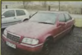
MERCEDES 190 C, 1986 r., 122 tys. km, 1800 ccm, benzyna, inst. gaz., bordowy metalik, wersja Elegance, automat, 2 poduszki pow., wspomaganie kier., ABS, el. ow. szyby, el. reg. lusterek i reflektory, centr. zamek na pilota, RO, CD, reg. fotela kierowcy, obrótmiernik, zegar, wykończenie w drewno, alum. felgi, tapicerka materiałowa, - 33.990 zł. F2603833