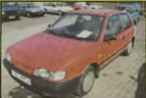
NISSAN SUNNY, 1993 r., 87 tys. km, 1400 ccm, benzyna, czerwony, wykończona reflektorami, listwy boczne, oddzielne zapłon, kolpaki, RO, oznakowany, dzielone tyłne operacje, stan b. dobry, - 13.900 zł. F2603843