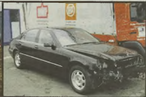
MB S 320 Lang 6/01r. automatic, klimatronic, skóra, xenon, PDC, alu 27.900 euro