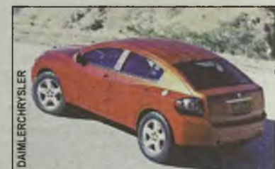
Masywny tył dobrze komponuje się...

Avenger napędzany jest 3.5-litrowym silnikiem V6. Zmiana biegów automatycznej skrzyni odbywa się za pomocą przycisków przy kierownicy.