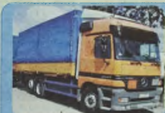
MERCEDES 2540 ACTROS GLOBETROTTER, MEGA SPACE BDF, roczniki 1998/1998, Euro II, Pakiet L, 400 KM, 3 osie, oś podwieszana, zawieszenie pneumatyczne, ABS, ASR, ogrzewanie webasto, tempomat, kabina sypialna maks. wyposażona, hak, ład. ok. 14 t, do wyboru kontener, plandeka, chłodnia, 7.20 x 2.45 m.