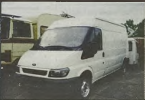
Ford Transit FT 330 90KM 6/2000r. 160 tys. km., ABS, radio 10.900 euro netto