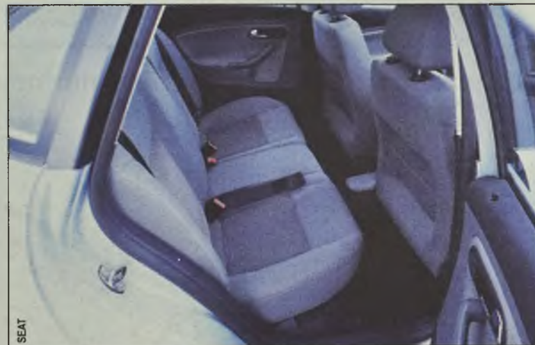
Siedząc z tyłu, można narzekać na mało miejsca