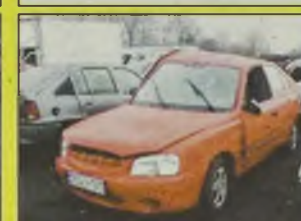
HYUNDAI ACCENT , 2000/02 r., 1300 ccm, czerwony, 1 rejestracja i sprzedaż w salonie w 2002 r., bogate wyposażenie, mocno uszkodzony bok - 13.500 zł oraz Accent, 1500 ccm, 12V, 5D, Super, 1996 r., zielony metalic, uszkodzony przód, bogate wyposażenie, z salonu - 9.900 zł.