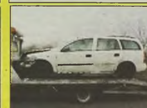
OPEL ASTRA II KOMBI , 1400 ccm, 16V, „Eco-tec”, biały, alum. felgi, centralny zamek, klimatyzacja, ABS, wspomaganie kier., 4 poduszki pow. (nie wystrzelone), uszkodzony delikatnie przód i dach, homologacja, faktura VAT, - 23.900 zł.