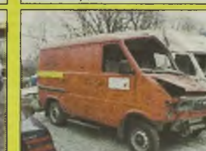
LUBLIN III 3302 , 1999/00 r., 2400 ccm, turbo D, czerwony, uszkodzony przód i dach - 11.900 zł brutto oraz Lublin III izoterma, 2001 r. i Lublin II furgon, 1997 r., uszkodzony - 9.800 zł.