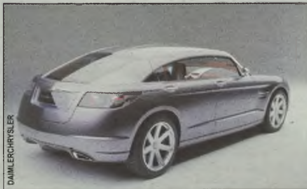
Linia auta, choć nowoczesna, przywołuje na myśl lata 60.

To interesujące rozwiązanie. Biorąc pod uwagę, że auta nie tankuje się codziennie, nikomu nie grozi ciągle otwieranie klapy bagażnika. Mamy za to idealnie gładkie, niczym nie zburzone linie. Nic dodać, nic ująć.