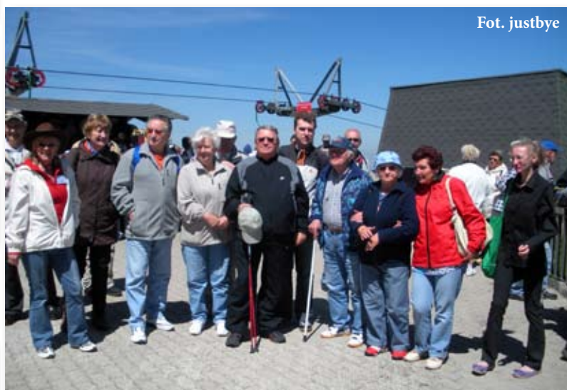
Niepełnosprawni w objęciach Liczyrzepy