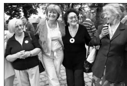
Fotografie – jelonka.com

jeleniogórskich. Wielokrotnie byłam pytana dlaczego „u nich” takich spotkań się nie organizuje. To tylko dowodzi, że żyjący wśród nas niepełnosprawni czasami w modlitwie wolą być sami, choć tak naprawdę zawsze jesteśmy RAZEM.