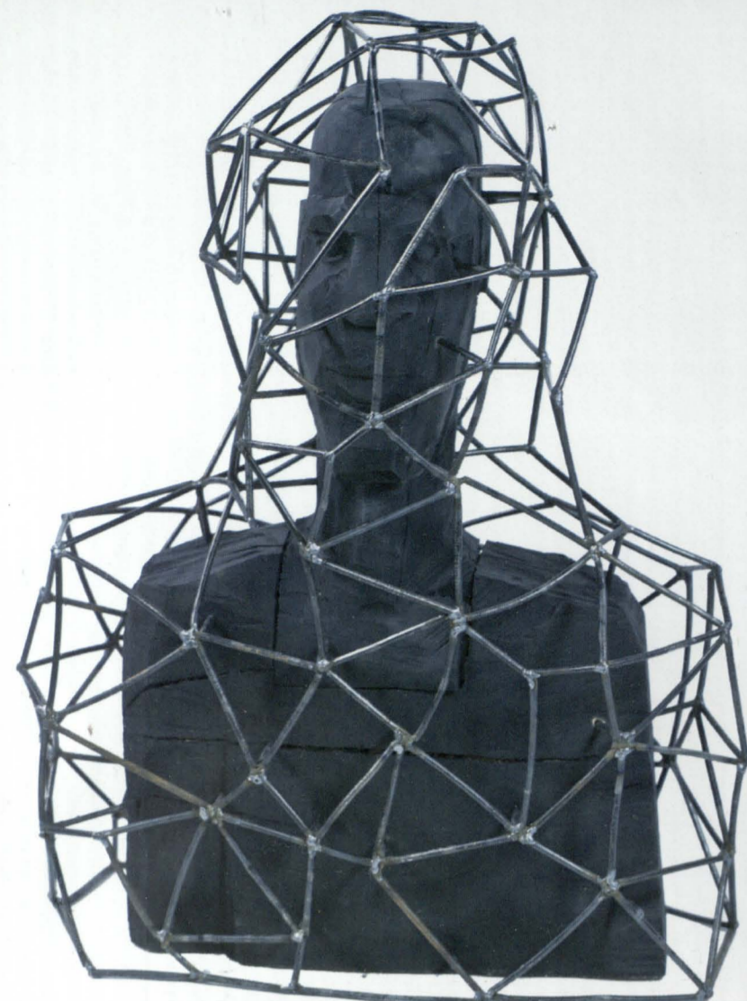
Ignacy Nowodworski, Strzyżulica powierzy, 2016, instalacja