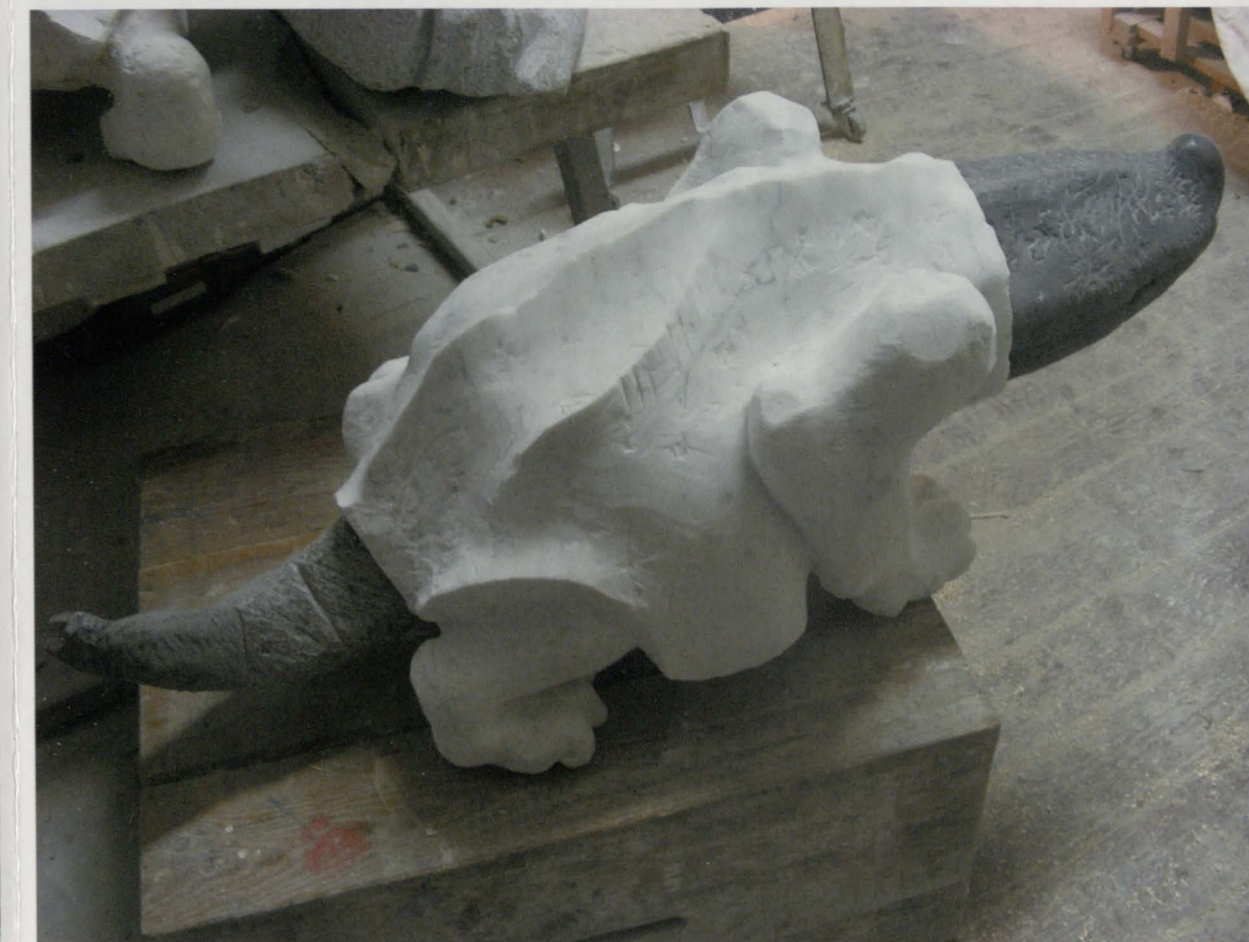
Tomasz Chmielewski, Portwór, 2014, marmur, kamień, 62 x 50 x 40 cm