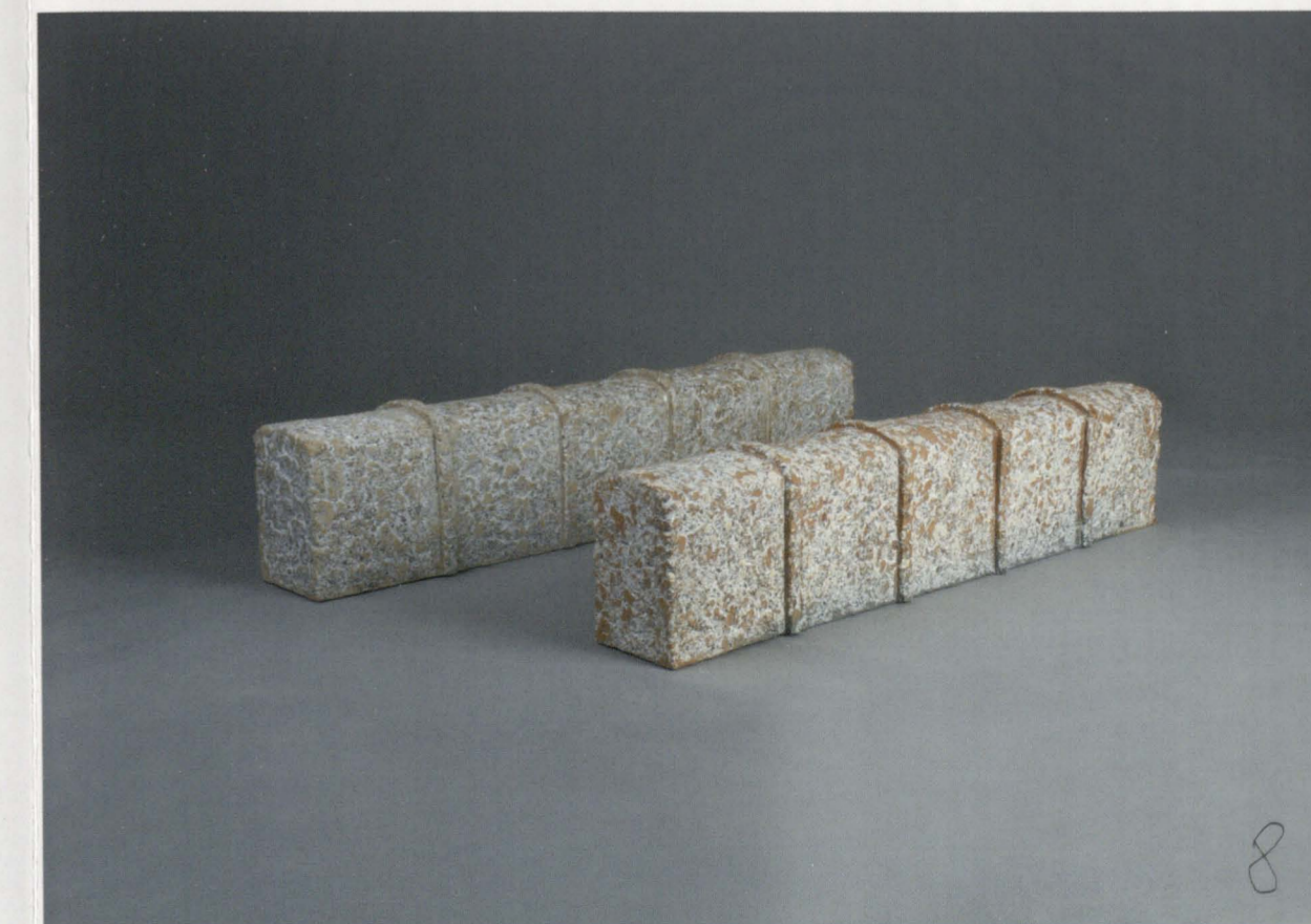
Krzysztof Rozpondek, z cyklu Perenne Opus, 2015 r., masa szamotowa, kamionka barwiona, 24x101x16 cm, 23x96x15 cm, fot. Maciej Kasperski

W swoich realizacjach wykorzystuje różnorodne masy ceramiczne, stosuje tradycyjne i eksperymentalne metody wypału. Tworzy abstrakcyjne kompozycje, w których poszukuje harmonii między formą, fakturą oraz barwą, a tym samym między istotą tworzywa, jego obróbką i metodą wypału.