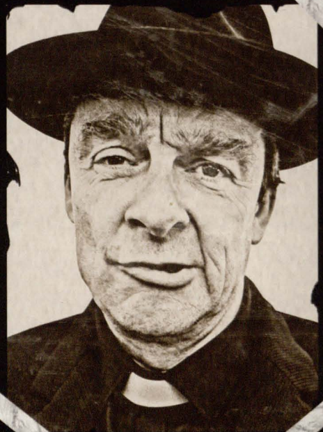
Oddany swemu zawodowi bez reszty (jedyna rentowna firma w Deer's Hill City). Pochował nawet swoją nogę i jeszcze na tym zarobił.