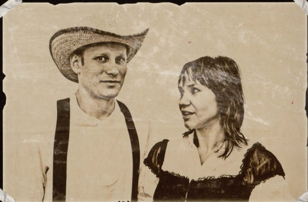
Kurwa Lucy ma na utrzymaniu siedemnastoosobową rodzinę, niewidomego braciszka oraz złote serce, które bije dla Młodego.