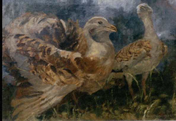
Dropie, 1995, olej, płótno