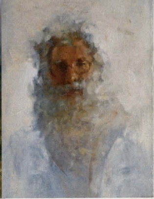
Autoportret, 2008 olej, płótno, płyta