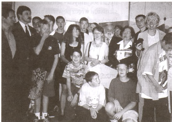
Nasi ubiegłorocznicy francuscy goście.

Istnieje duża szansa na ponowny wyjazd naszych młodych mieszkańców gminy na 10-dniowy wypoczynek. Podobnie, jak w roku 1999, strona francuska deklaruje pokrycie części kosztów pobytu. Koszty przejazdu oraz pozostałe koszty pobytu uczestnika pokryją wyjeżdżający.