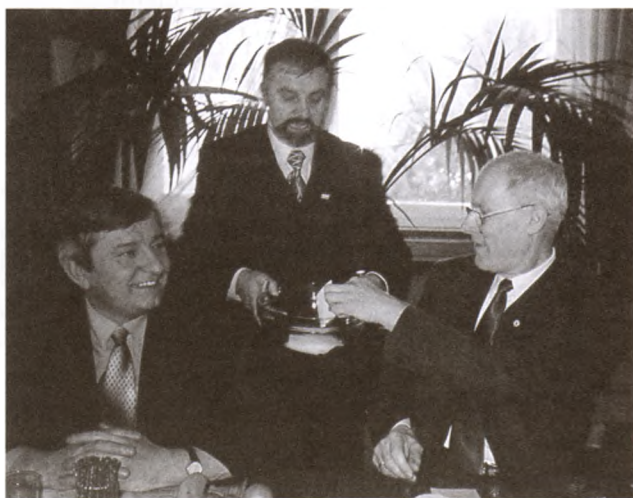
Głosowanie na walnym zebraniu Stowarzyszenia gmin.