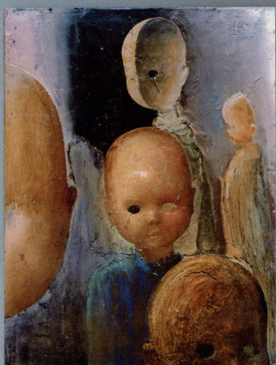
ROSTISLAV ZÁRYBNICKÝ ur. 1936 w Sklini na Volini adres: Široká 1 460 01 Liberec tel. (atelier) +420/48/5104886

Finansowane przez Unię Europejską w ramach programu Phare Credo Financed by EU PHARE CREDO program