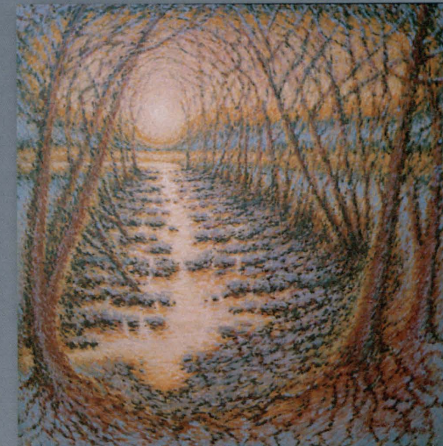
STANISLAV MASÁK ur. 1950 Vratislavice nad Nysą adres: 460 01 Liberec 3 Vaňurova 815 tel. +420/48/421667

„Dwie siostry” (prawa część dyptyku) olej na płótnie 90 x 65