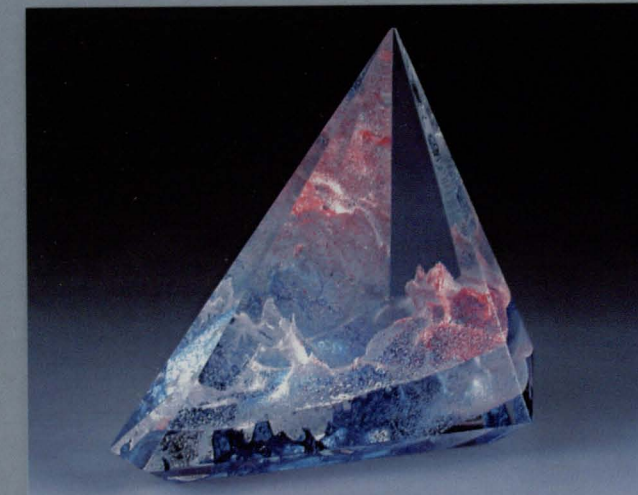
VACLÁV HANUŠ ur. 1924 w Mlázovických adres: U Kostela 15 Jablonec n.N. 466 04