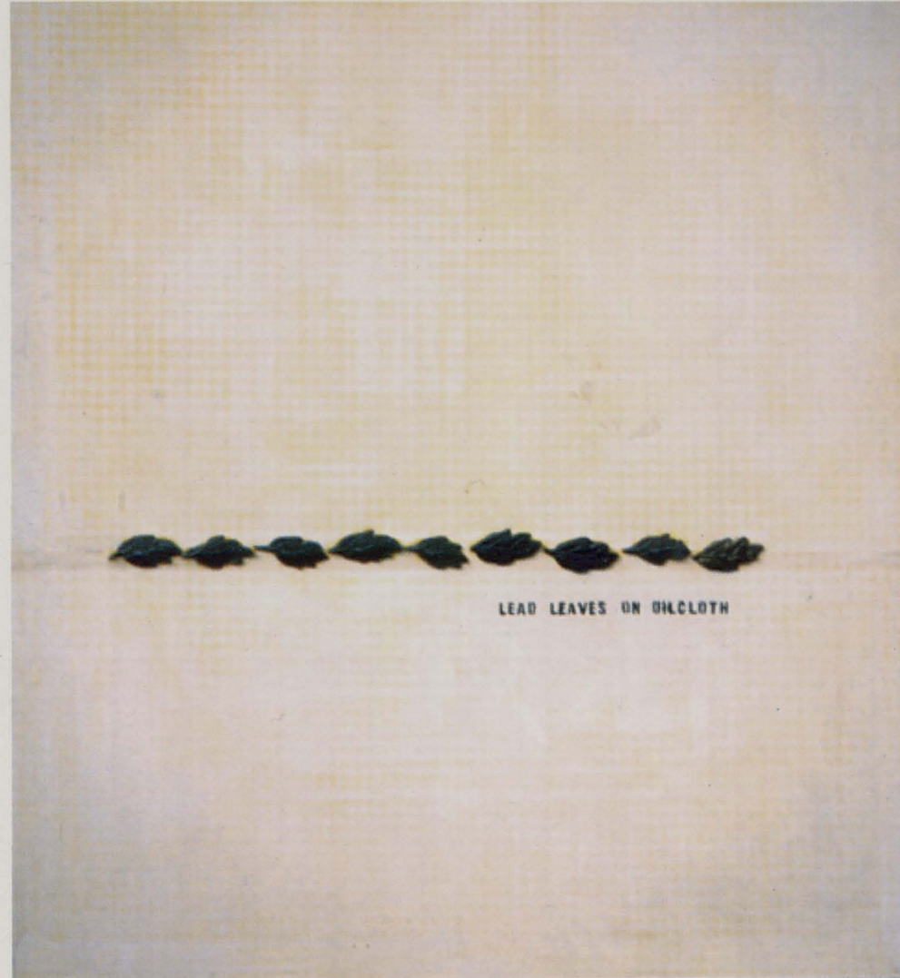
ołów na ceracie, (lead leaves on cloth), 120 x 150 cm, 1994