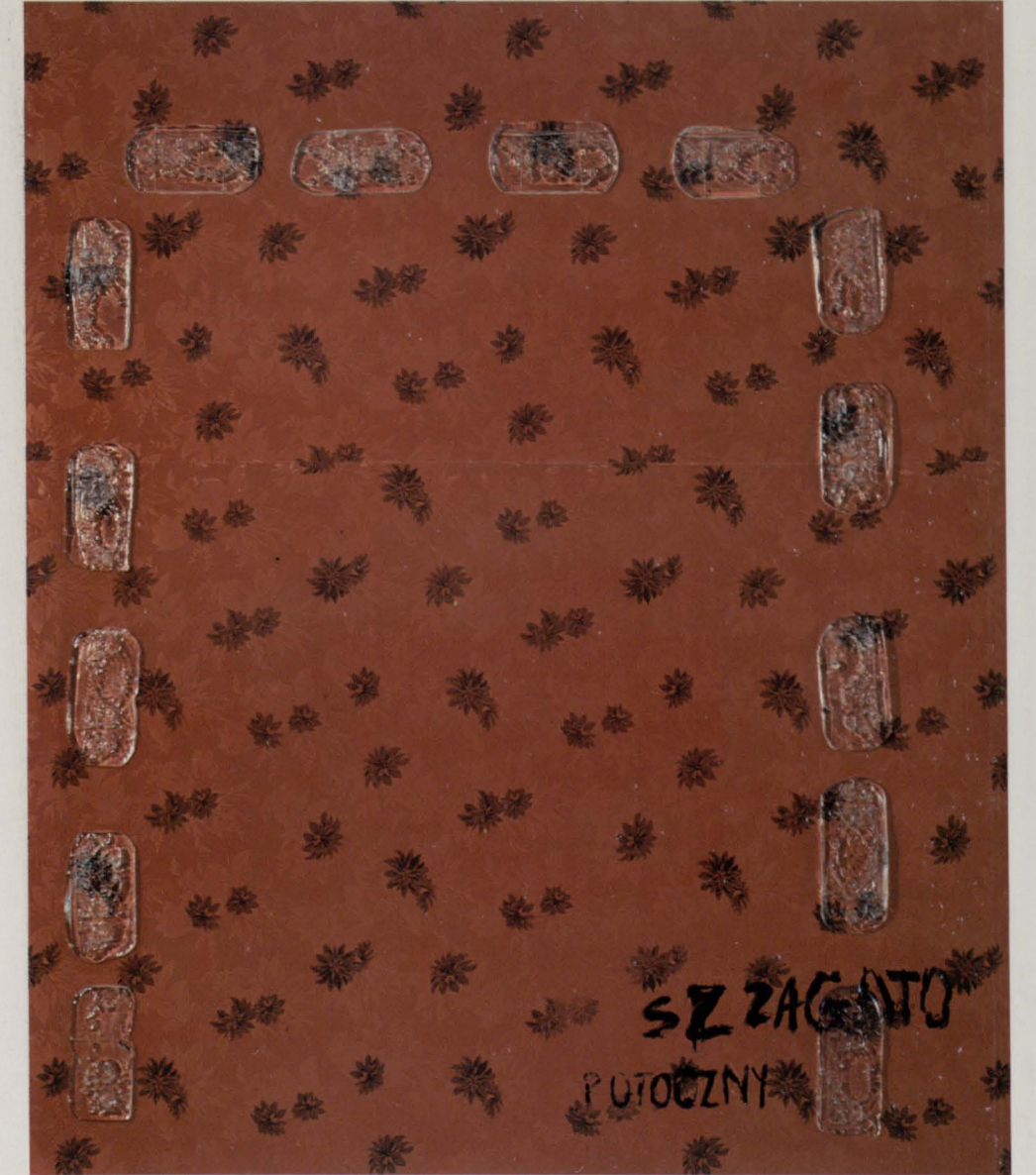
"SZ ZAGATO", szkło na ceracie, (glass on cloth), 195 x 215 cm, 1992