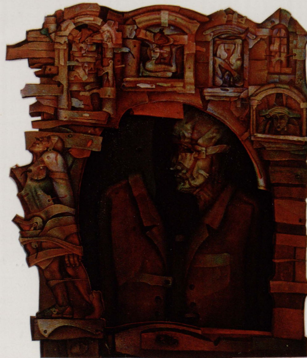
"Portret okienny II", olej-płótno, płyta pilśniowa-olej 110x130 cm. 1994 r.