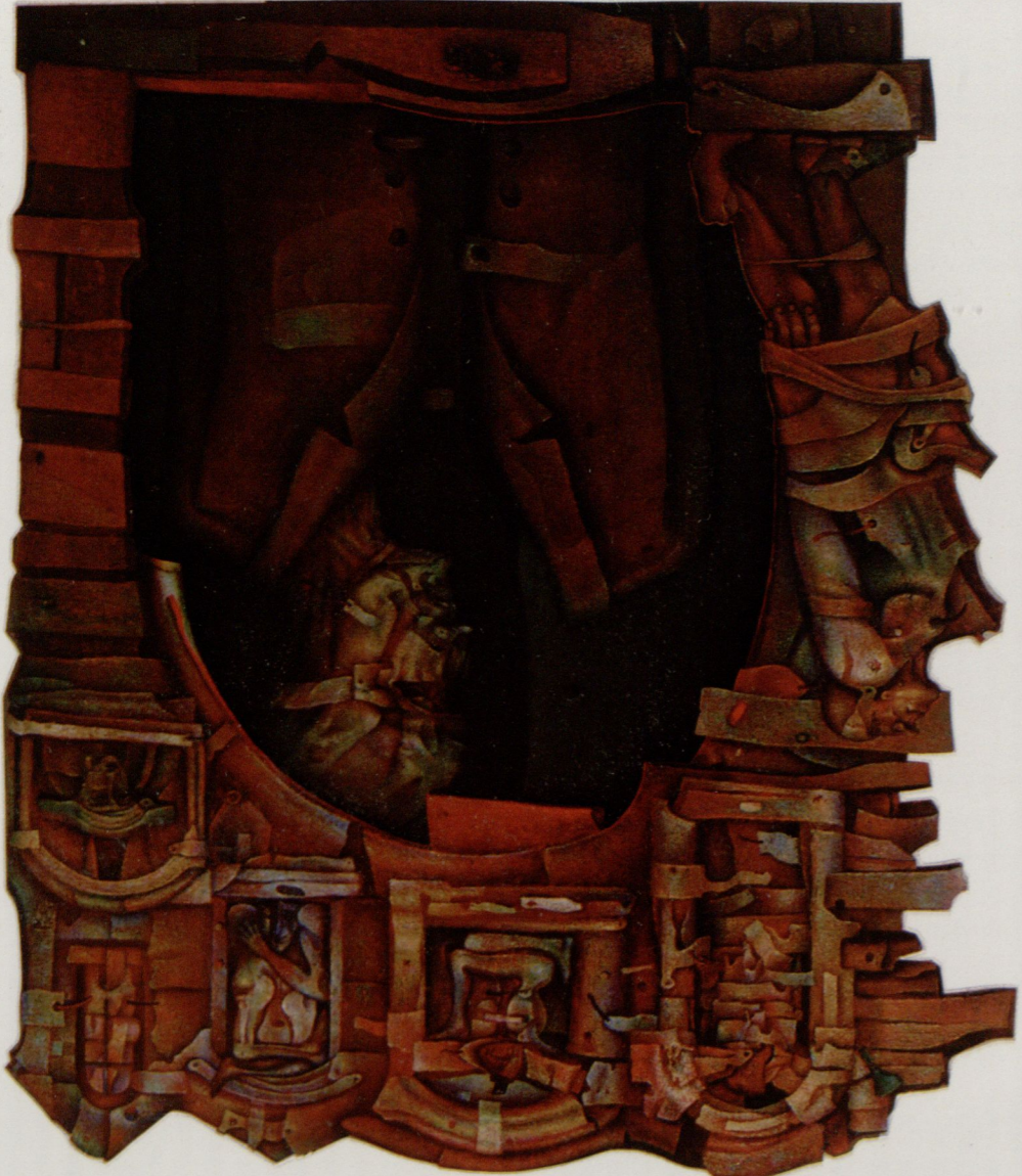
"Portret okienny II", olej-piótło, płyta pilśniowa-olej 110x130 cm. 1994 r.