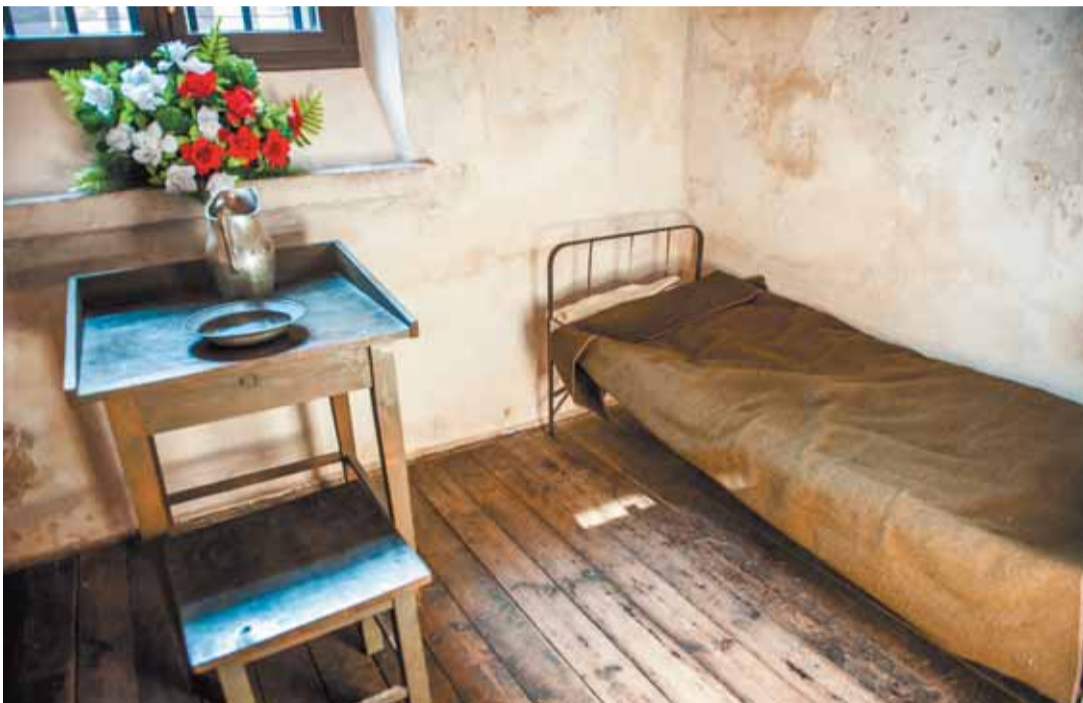
Cela Romualda Traugutta

wój więźniów kryminalnych i politycznych przeszedł granicę z Azją – mówi Engelgard, przypominając, że w latach 60. XIX w. koleje podchodziły tuż za Moskwę, a dalej trzeba było zazwyczaj iść na piechotę. Podróż trwa-