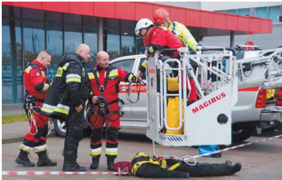
Demonstracja ratowania człowieka po upadku z dużej wysokości

Raporty PIP niezmiennie od kilku lat wskazują, że wśród ważniejszych przyczyn wypadków znajdują się: niewłaściwa organizacja pracy, brak przeszkolenia z zakresu zasad bhp oraz zły stan zdrowia psychofizycznego pracowników i pracownic wywołany zbyt długim czasem pracy i przemęczeniem. Najwięcej wypadków zdarza się w branżach: budowlanej, górniczej, przetwórstwie przemysłowym oraz w transporcie. PIP nie bada wszystkich wypadków w pracy – jedynie śmiertelne, z ciężkimi obrażeniami ciała