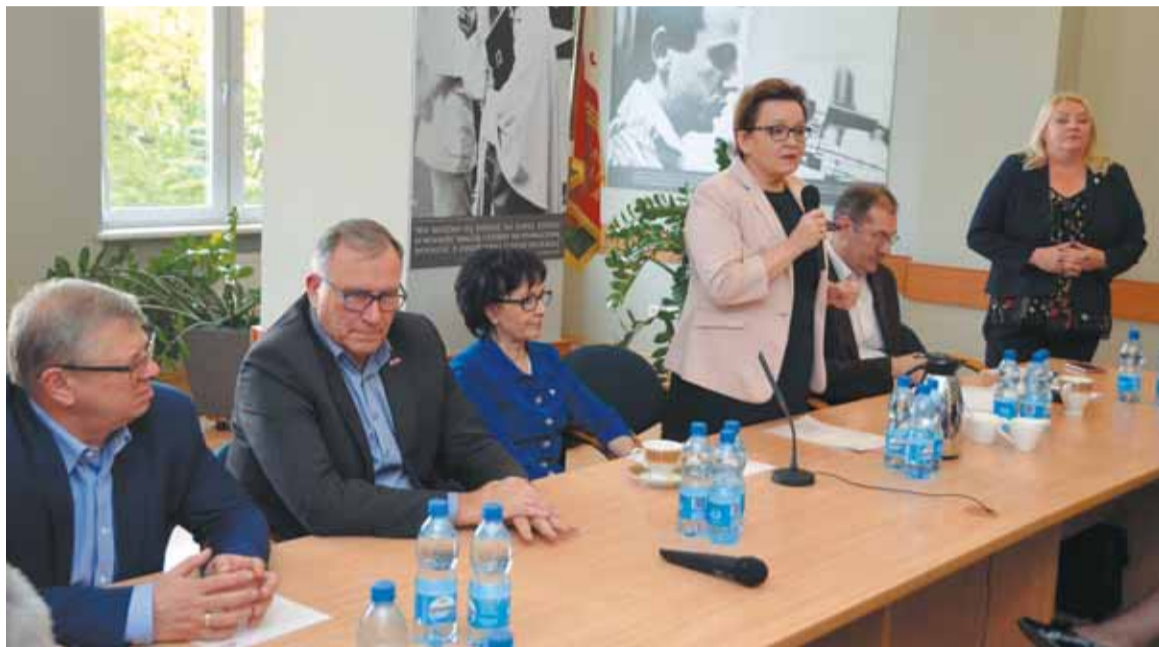
Minister Anna Zalewska blisko trzy godziny rozmawiała ze związkowcami

W przeddzień Dnia Edukacji Narodowej w siedzibie dolnośląskiej „Solidarności” doszło do spotkania związkowców z minister Anną Zalewską, której towarzyszyła minister Elżbieta Witek i dolnośląski kurator Roman Kowalczyk.