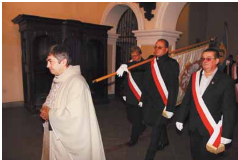
Obrady poprzedziła msza św. w kościele pw. Podwyższenia Krzyża Świętego w Strzelinie