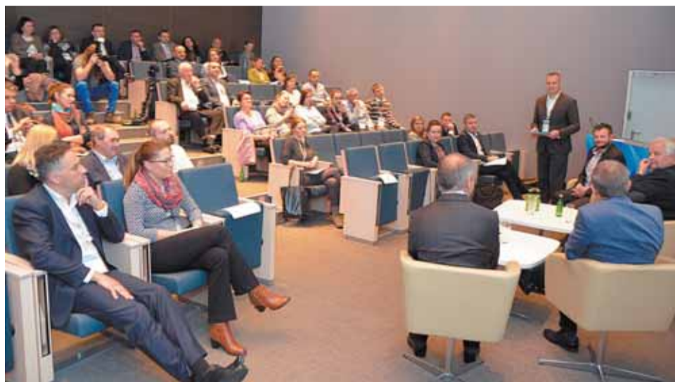
Uczestnicy panelu dyskusyjnego w firmie 3M

Jeden z dyskutantów postawił publicznie pytanie, co możemy zrobić, by nie było więcej wypadków przy pracy? Paneliści podkreślali, że konieczne są wzmoczone szkolenia, budzenie świadomości BHP już w szkole, a kiedy nic nie skutkuje, trzeba dotkliwie karać łamiących przepisy.