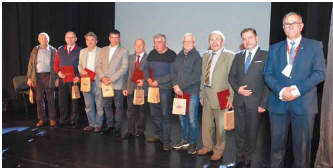
Zasłużeni działacze strzeleńskiej „Solidarności”