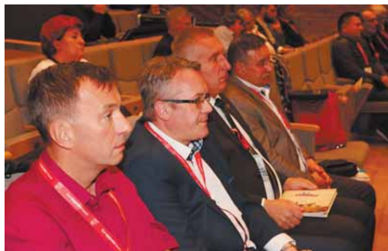
Delegaci na sali obrad

Przygotowywana jest zmiana ustawy o związkach zawodowych – idzie w kierunku tzw. reprezentatywności. Podwyższony zostanie próg dotychczasowej reprezentatywności ponadzakładowej związków