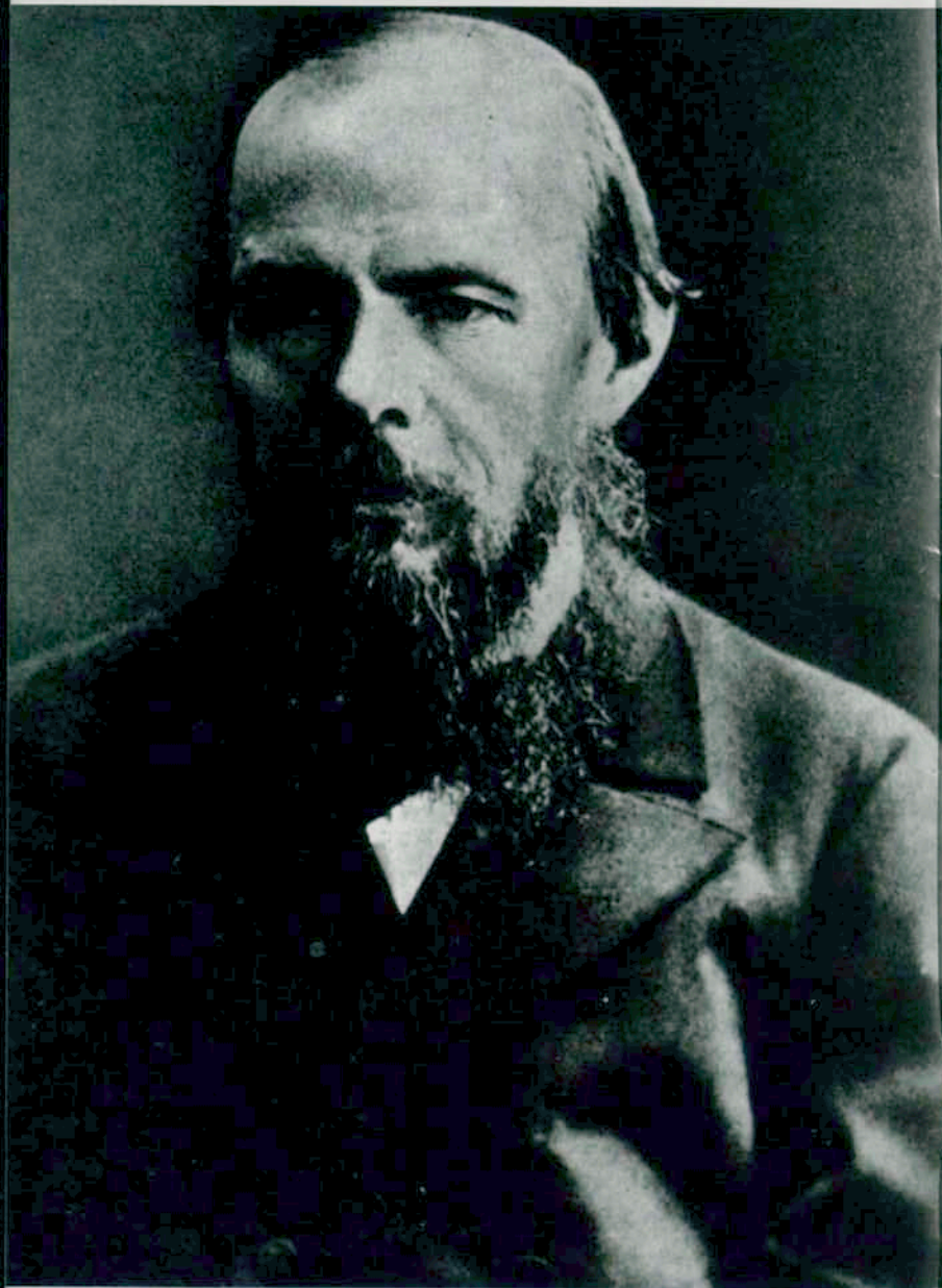
FIODOR DOSTOJEWSKI (1821-1881)

"Jeśli przyjdzie mi wybierać między Prawdą i Chrystusem – to wybiorę Chrystusa"