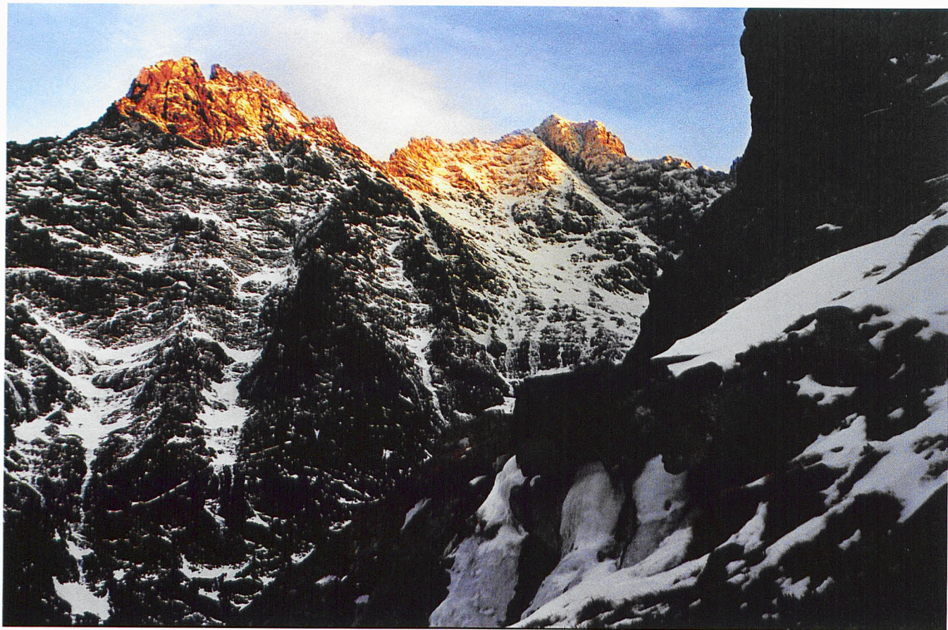
Krystyna Nowak , „W ostatnich promieniach słońca...” — III nagroda