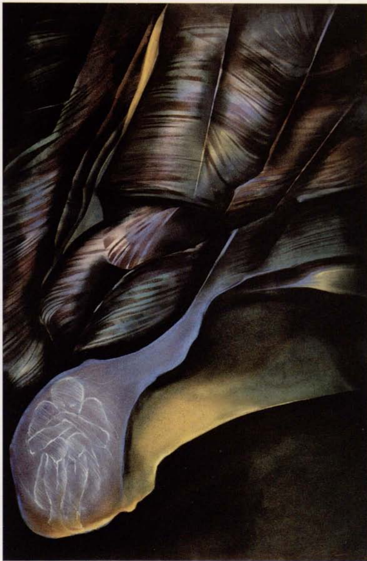
LĘK - olej na papierze