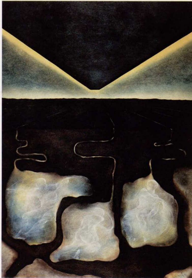
PROCESY ISTNIENIA I - olej na papierze