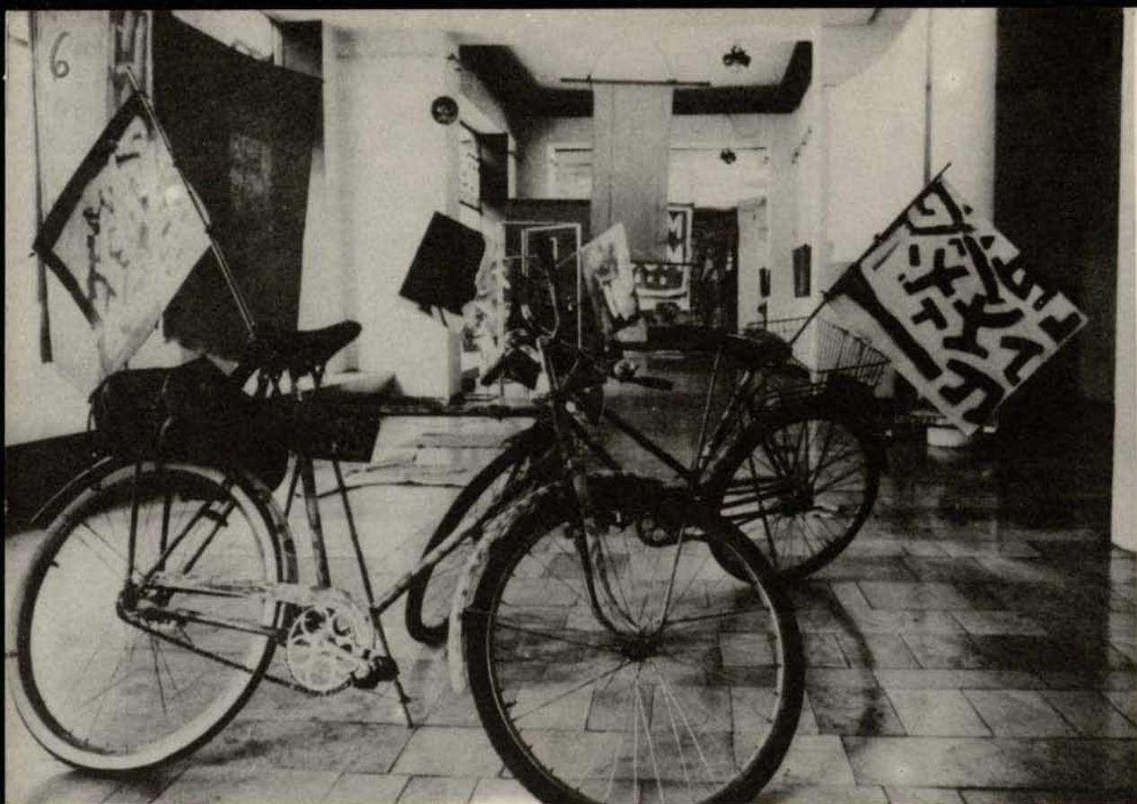
„Rowery” i „Sztandary” — „Mały Salon” BWA Wrocław