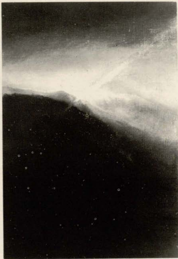
ELŻBIETA SZCZUBLEWSKA Łódź ul. Wólczańska 147 m. 23

Studia w PWSSP w Łodzi, dyplom w 1972 roku. Zajmuje się malarstwem. Udział w wystawach zbiorowych, wystawy indywidualne. Prace w zbiorach prywatnych w kraju i za granicą.