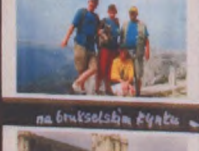
na bruxelskim rynku