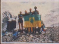
OM zawsze zwycięży!