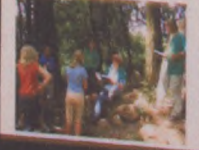
OM jest zawsze w czołowej grupie!