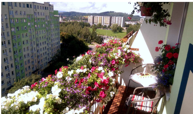
Balkon, który zajął pierwsze miejsce.

Ze zrozumiałych względów nie podajemy adresów zwycięzców.