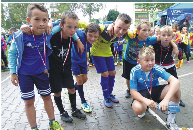
III miejsce – Zabobrze