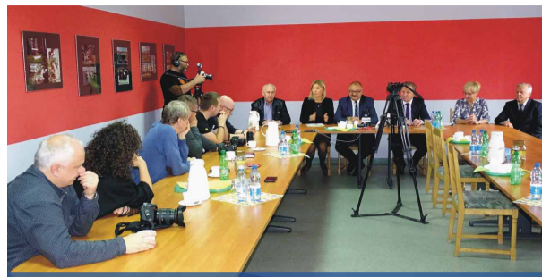
Konferencja prasowa odbyła się w budynku biurowym JSM