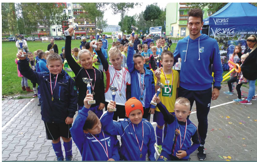
I miejsce – Żuki