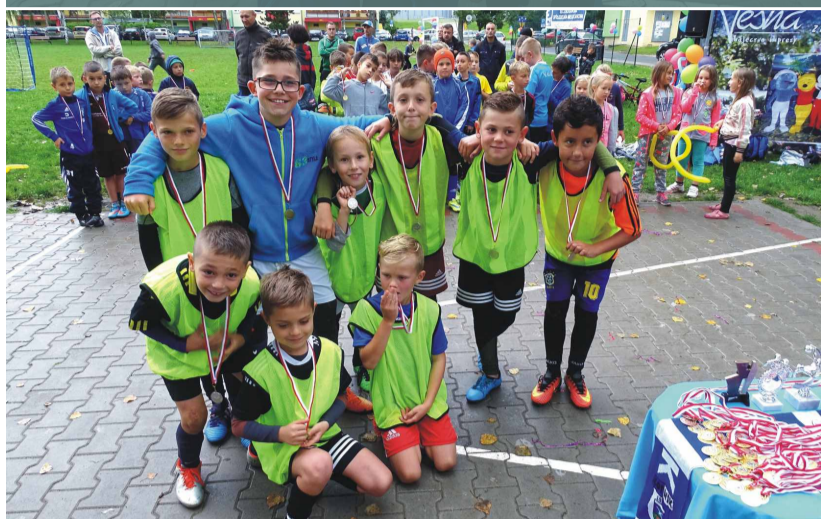
II miejsce – Lemury