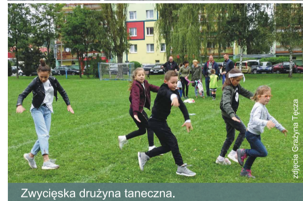
Zwycięska drużyna taneczna.