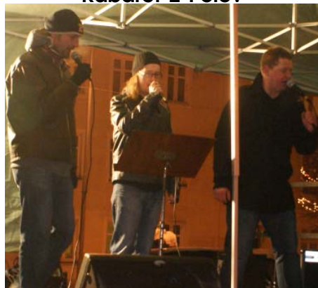
Kabaret 2 Polev