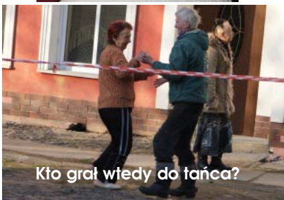
Kto grał wtedy do tańca?