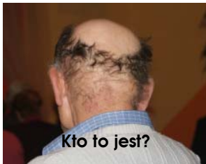
Kto to jest?