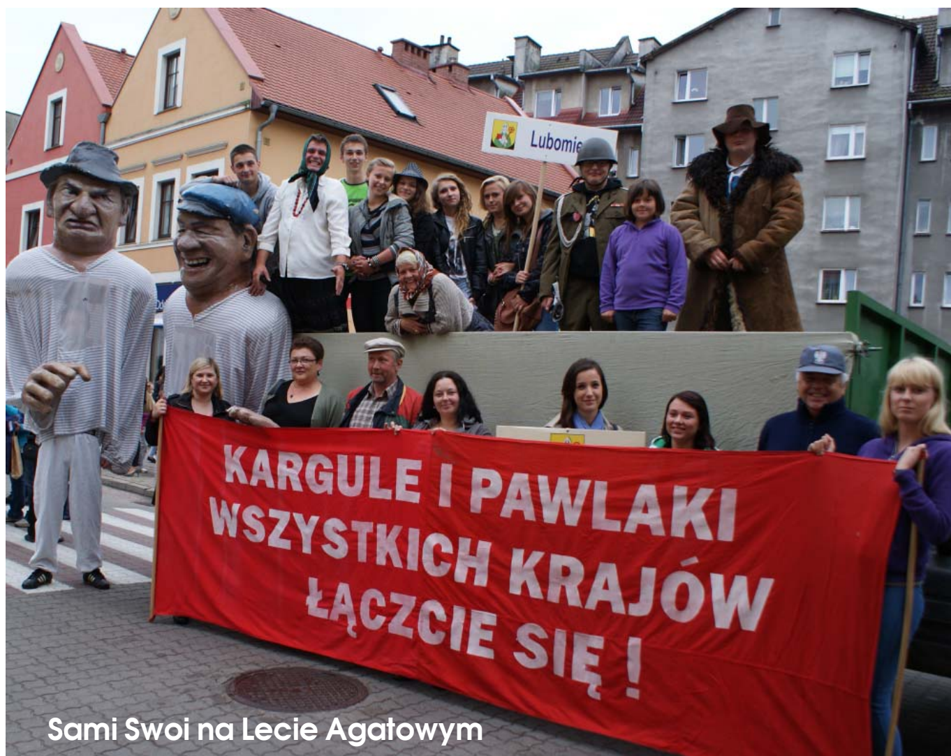
Sami Swoi na Lecie Agatowym

Nr 240 • lipiec 2013 r. • ISSN 1233-3093 • cena 2,00 zł