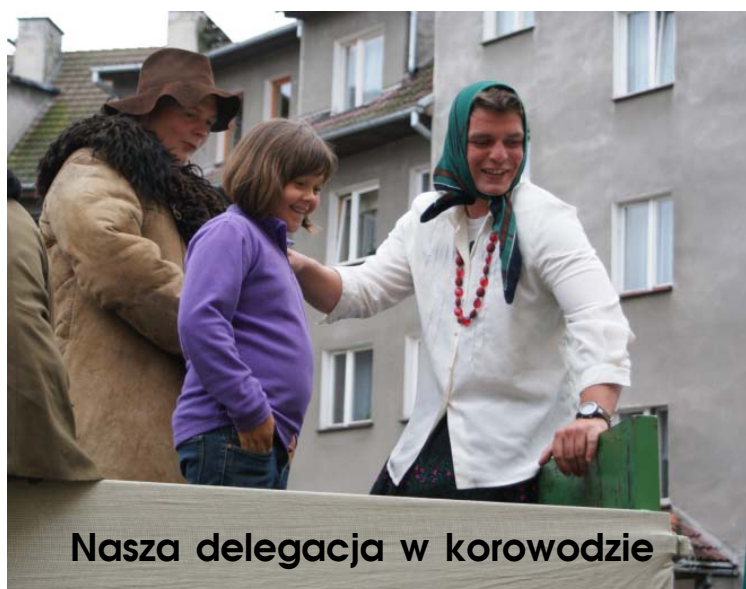
Nasza delegacja w korowodzie