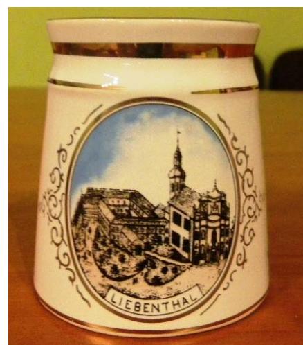
Pamiątki z okazji 150-lecia Szkoły w Lubomierzu