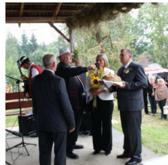
OKiS był współorganizatorem tegorocznych dożynków w Radoniowie. Relacja z tej niezapomnianej imprezy na następnej stronie.