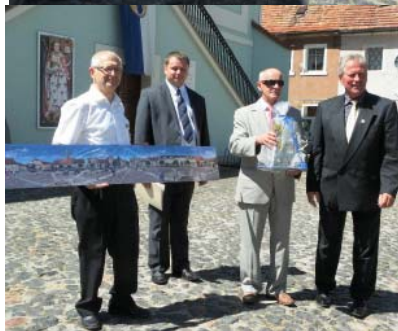
Podczas obchodów 5 lecia partnerstwa miast Wittichenau i Lubomierz odłonięta została pamiątkowa tablica