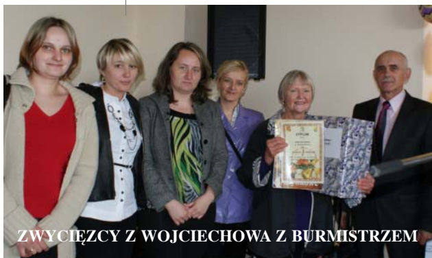
ZWYCIĘZCY Z WOJCIECHOWA Z BURMISTRZEM