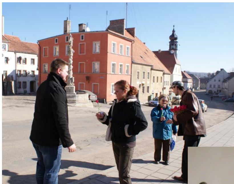
Dzień Kobiet w Lubomierzu