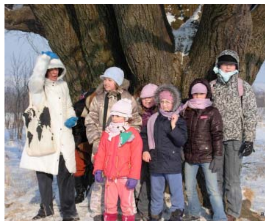
Ferie zimowe w Radoniowie

Warsztaty ozdób z makaronu zorganizowane przez OKiS