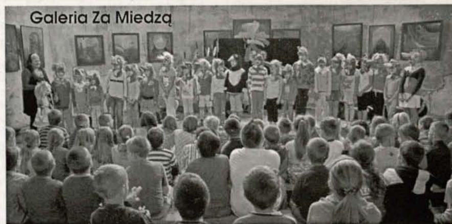
Galeria Za Miedzą