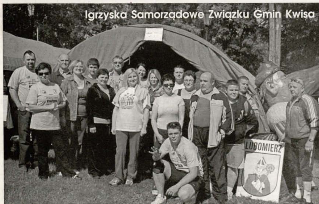
Igrzyska Samorządowe Związku Gmin Kwisa