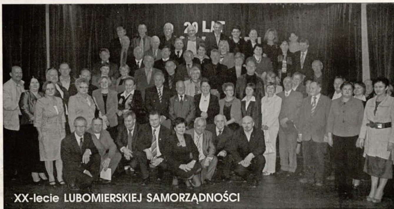
XX-lecie LUBOMIERSKIEJ SAMORZĄDNOŚCI