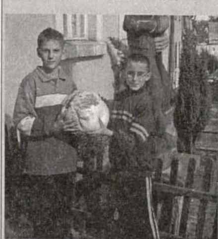
Ci dwaj młodzieńcy znaleźli taką ogromną purchasek!