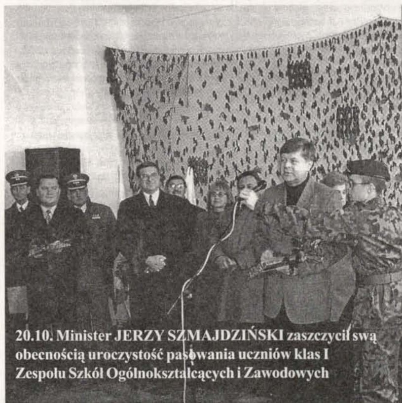
20.10. Minister JERZY SZMAJDIŃSKI zaszczylił swą obecnością uroczystość pasowania uczniów klas I Zespołu Szkół Ogólnokształcących i Zawodowych

Nr 125 • październik 2003 r. • ISSN 1233-3093 • cena 2 zł