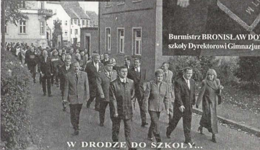
W DRODZE DO SZKOŁY...