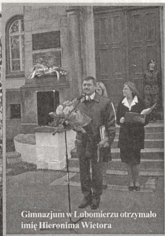
Gimnazjum w Lubomierzu otrzymało imię Hieronima Wietora