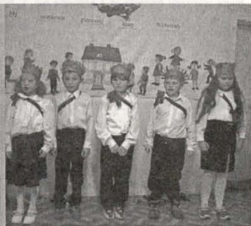
Uczniowie klasy I Szkoły Filialnej w Olesznej Podgórskiej przed pasowaniem