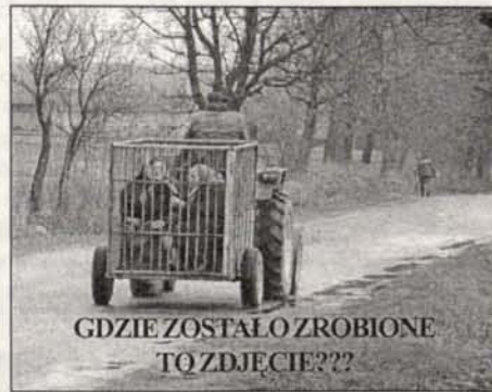
GDZIE ZOSTAŁO ZROBIONE TO ZDJĘCIE???