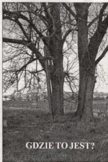
GDZIE TO JEST?

Skończyła się zima. Warto przypomnieć sobie o rowerze. Zwolennicy aktywnego wypoczynku znowu mogą kontynuować przejażdżki rowerowe w coraz cieplejszych dniach wiosennych. Proponujemy pokonanie trasy wokół Lubomierza. Od miasta przy ul. Jeleniogórskiej jedziemy w kierunku południowym wzdłuż rzeczki Lubomierki ulicą Sportową do boiska sportowego Stelli. Za boiskiem wjeżdżamy do lubomierskiego lasu. Zaraz za mostem kamiennym skręcamy w prawo i obok leśniczówki drogą leśną przejeżdżamy aż do jej wylotu do drogi Lubomierz – Chmielów koło stawu hodowlanego. Mijamy drugi most na Lubomierze i drogą wysadzoną lipami obok ogródków działkowych „Sami Swoi” dojeżdżamy do Lubomierza. Przy szkole podstawowej jeżdżamy w lewo, w ulicę Partyzantów,