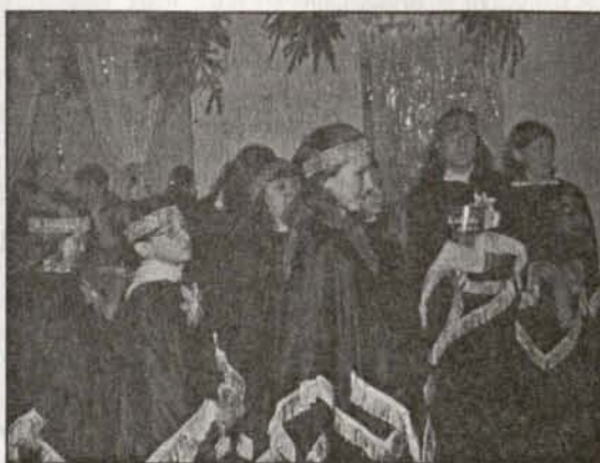
Oczekiwanie na występ w konkursie kolęd