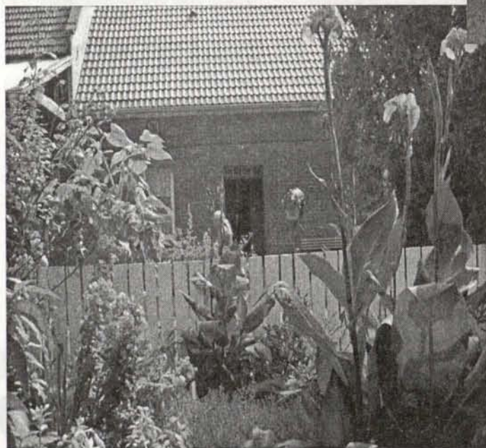
Tak z „Pawlakowego podwórka” widać „zagrodę Kargula”

Podczas tegorocznego Festiwalu tradycyjnie już gościliśmy delegację z Dobrzykowic, w których też kręcone były zdjęcia do trylogii SYLWESTRA CHĘCIŃSKIEGO. Już po raz trzeci odbył się tam festyn „Sami Swoi”. Zostaliśmy zaproszeni na imprezę. Spotkaliśmy się z Jerzym Janeczkiem, Sylwestrem Chęcińskim, odwiedziliśmy znajome miejsca.