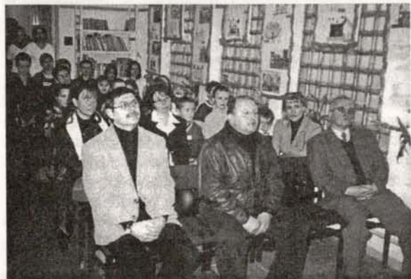
Rozstrzygnięcie konkursu rysunkowego