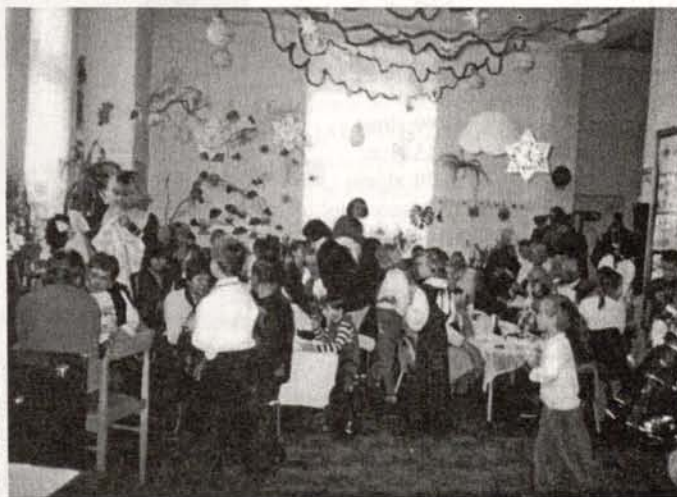
Dzień Babci i Dziadka w Miejskim Przedszkolu