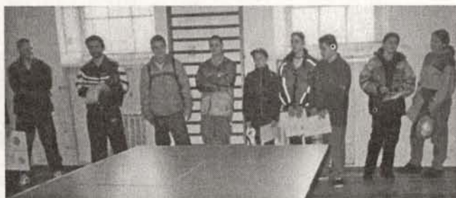
Gminny Turniej Tenisa Stołowego